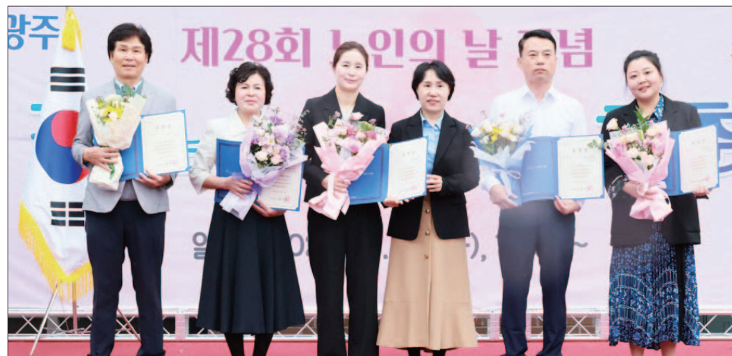
효령노인복지타운, 제28회 노인의 날 기념행사 성료 광주사회서비스원 소속 효령노인복지타운은 15일 제28회 노인의 날을 기념해 지역 어르신들을 위한 행사를 성황리에 개최했다.