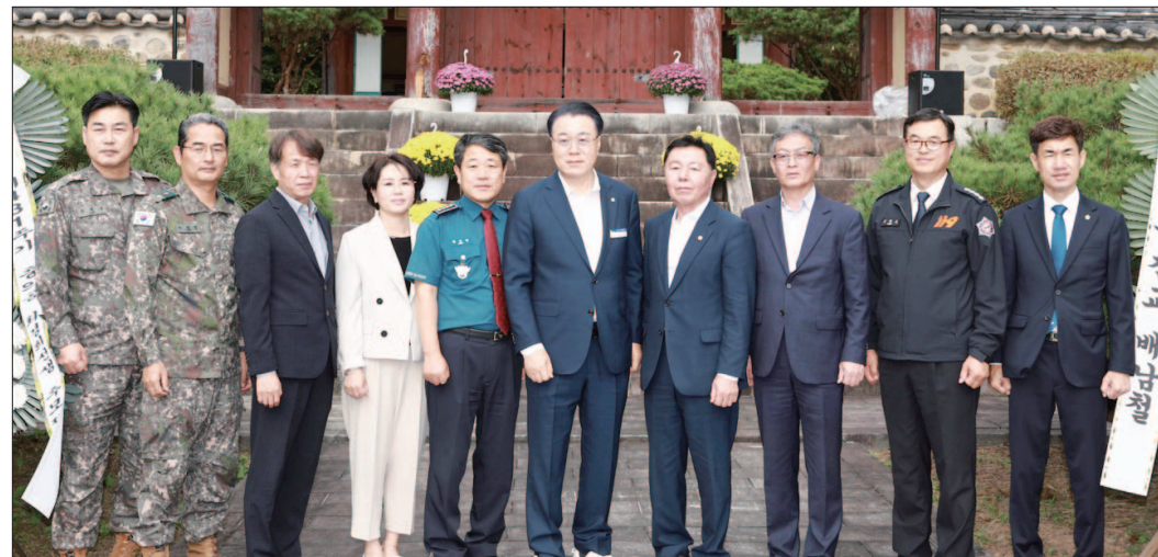
화순군은 최근 동면 총의사에서 '충의공 최경회 선생 순절 431주기 추모제'를 개최했다.