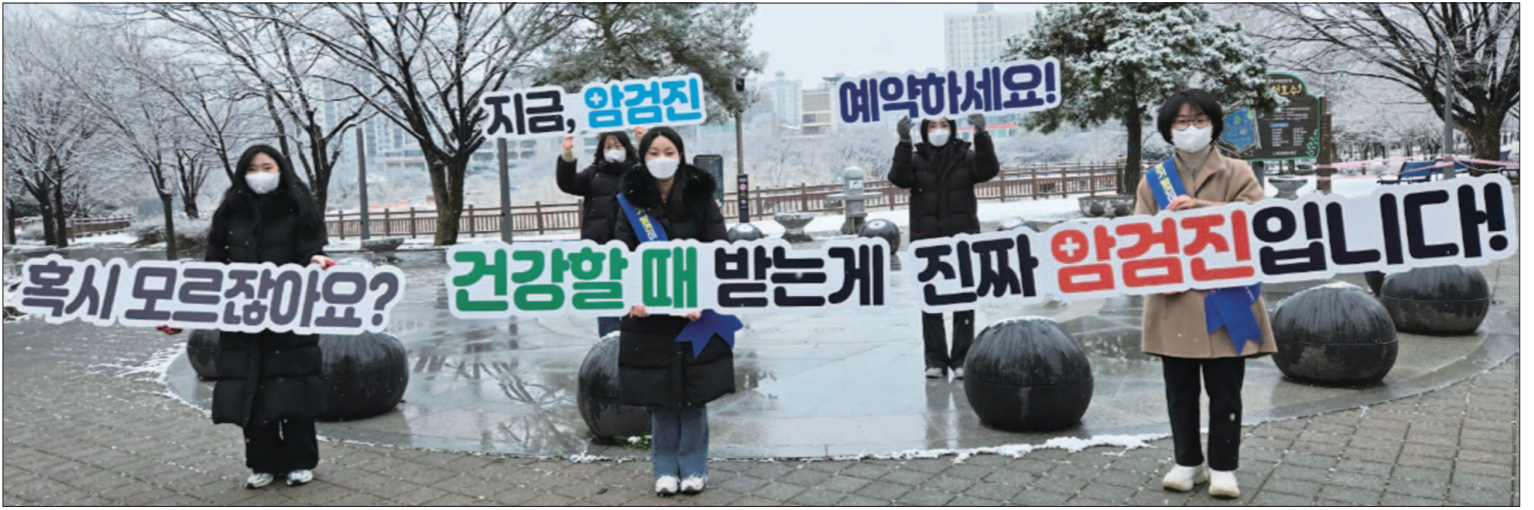
광주시는 ‘암 예방의 날’(3월 21일)을 맞아 18일 서구 운전저수지 사거리에서 출근길 운전자를 대상으로 ‘2025년 암 예방의 날 홍보 캠페인’을 벌였다.

20세 이상 여성은 자궁경부암, 40세 이상은 위암·간암·유방암, 50세 이상은 대장암 검진을 받을 것을 안내했다.