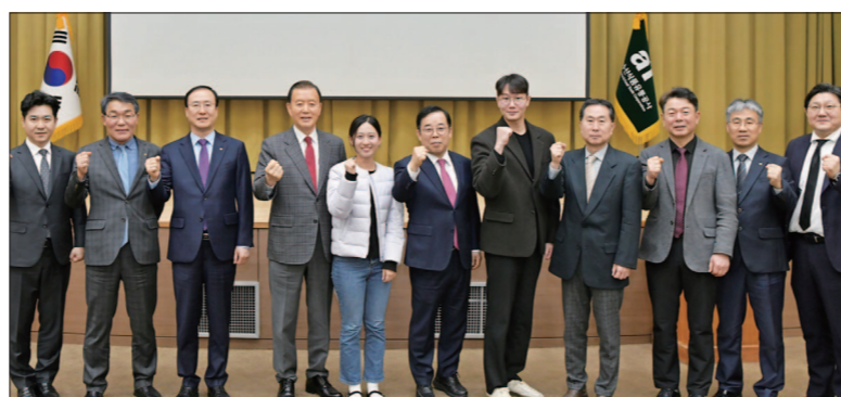
이송훈 기자 photo25@

술로, 업무 혁신과 생산성 향상을 필수 요소 중 하나”라며 “이번 교육을 시작으로 전사적인 AI 역량 강화를 지속 추진하고, 농수축산업의 디지털 혁신을 선도할 것”이라고 말했다.