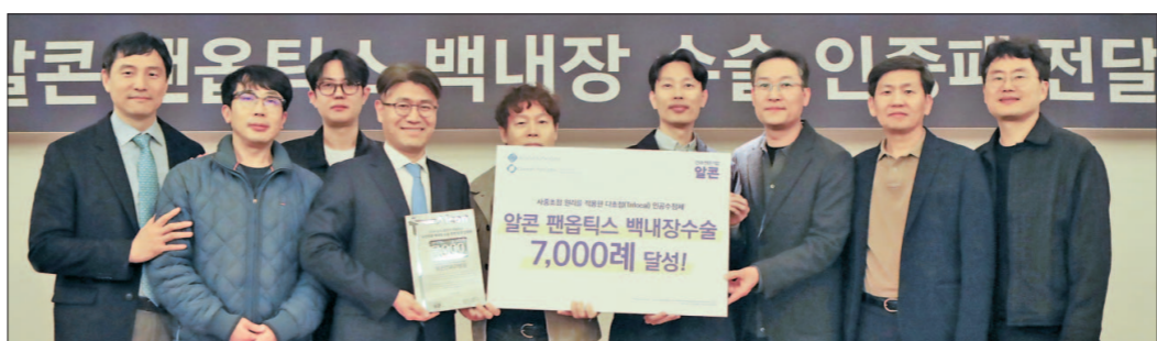
밝은안과21병원은 최근 글로벌 안과 전문기업 알콘사로부터 팬옵틱스 수술 7000건 달성 인증패를 수여 받았다.

년을 맞아 고객, 지역사회와 함께 성장하도록 최선을 다하겠다"고 다짐했다. 한편 KTX는 2004년 개통 이후 대한민국 고속철도의 새로운 장을 열었으며, 지역 교통편의 증진·지역경제 발전에 크게 기여해 왔다. 임영진 기자 looks@gwangnam.co.kr