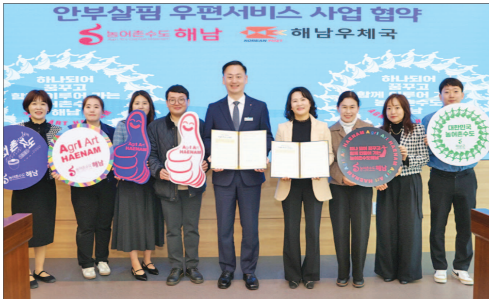
해남군은 최근 해남우체국과 '안부살핌 우편서비스' 업무협약을 체결했다.