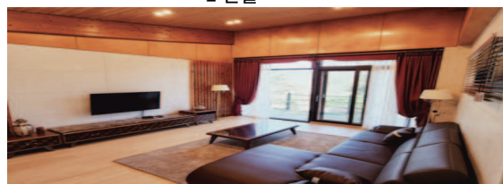
- 별채 -