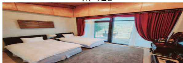
- 별채 -