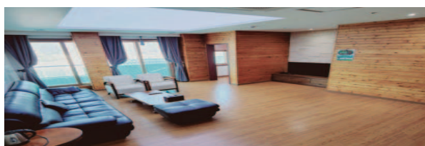
- VIP 4인실 -