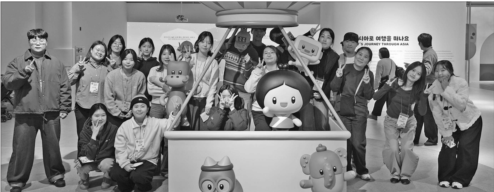
국립아시아문화전당재단(사장 김명규·ACC재단)은 ‘2025년 지역혁신중심 대학지원체계 사업(RISE)’의 하나로 진행한 ‘어린이 문화예술 전문인력 양성’과 ‘어린이·가족 문화예술교육 콘텐츠 공모’ 사업을 성황리에 마무리했다. 사진은 어린이 문화예술 전문인력 양성 프로그램 참가자들이 기념사진을 찍는 모습.

특히 최근 개편한 어린이문화원 상설 전시 ‘우리 모두의 집, 아시아’와 연계해 실무 중심 교육과 현장 적용 가능한 콘텐츠 발굴 기회를 제공해 눈길을 끌었다. 이를 통해 지역 대학생과 청년이 현장에 직접 참여하는 광주 기반 인재 양성 모델을 구체화했다. 이에 앞서 전당재단은 ‘2025 ACC 어린이·가족 문화예술교육 콘텐츠 공모’를 실시했다. 국립아시아문화전당과 5·18 문화유산을 소재로 창의적인 예술교육 프로그램을 개발하도록 한 이번 공모에서는 어린이·가족 참여형 프로그램을 제안한 4개 팀이 최종 선정됐다. 선정된 콘텐츠는 2026년 상반기부터 어린이문화원에서 시범 운영한다. 김명규 전당재단 사장은 “광주시 지역