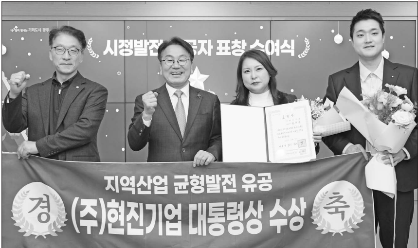
현진기업은 최근 이산화탄소(CO2) 저감 공기청정기와 작업장 밀폐공간 유해가스 배출 시스템을 전국 최초로 개발한 공로를 인정받아 2025년 지역산업 균형발전 유공(지역산업진흥 부문)으로 대통령 표창을 수상했다.

중심으로 적용 가능성이 주목된다. 현진기업은 기존 정수장 여과제 재생 기술을 공기질 관리 분야로 확장해 CO2 저감 및 유해가스 제거 기술 고도화를 추진하고 있다. 이를 바탕으로 학교·공공기관·작업 밀폐 공간 등 다양한 인프라에 적용돼 운영비 절감과 국산화 기반의 안정적인 A/S 체계를 구축하고 해외 공공시장 진출도 본격화할 계획이다. 현진기업은 수처리 분야를 중심으로 80여건의 특허를 보유하고 있으며 지난해 기준 전국 판공서 납품 실적 1위를 기록한 중견기업으로 자리매김했다. 송대웅 기자 sdw0918@gwangnam.co.kr