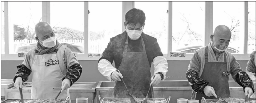
동아여자중학교는 최근 소원봉사 주지 도계 스님, 자비신행회 자원봉사자들과 함께 ‘찾아가는 매콤달콤 떡볶이 가게’를 운영했다.