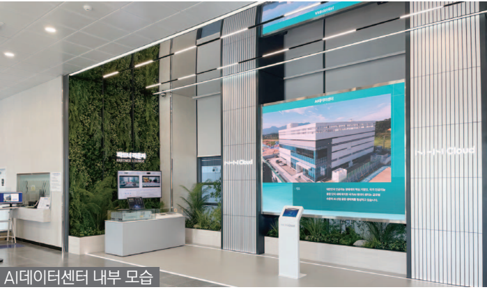
AI 데이터센터 내부 모습