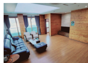
- VIP 4인실 -