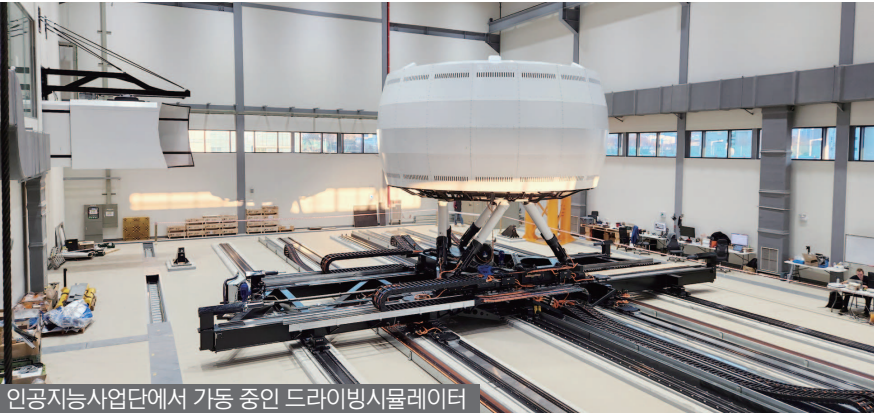
인공지능사업단에서 가동 중인 드라이브시뮬레이터