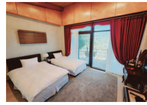
- 별채 -