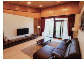
- 별채 -