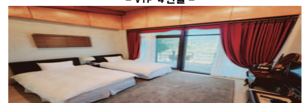
- 별채 -