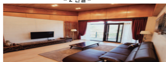
- 별채 -