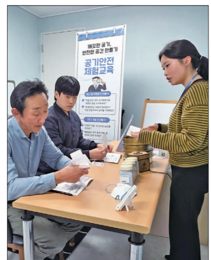
체험객들이 최근 '공기안전체험관'을 방문해 공기안전체험교육인 미니 공기청정기를 만들고 있다.

공기의 중요성을 직접 체험하고 배울 수 있는 공간이 광주 도심에 문을 열었다. 미세먼지와 각종 유해물질에 대한 우려가 커지는 가운데, 실생활에서 활용 가능한 공기질 관리 방법을 직접 체험할 수 있어 주목된다. 한국공기안전원은 시범운영을 거쳐 지난 1일 광주 북구 신안동에 '공기안전체험관'을 마련했다. 체험관은 기후변화와 환경 문제에 대한 인식을 높이고, 시민들이 공기 위생의 중요성을 체감할 수 있도록 조성된 공간이다. '공기 위생 극대화'를 주제로 △체험존 △교육존 △검증존으로 구성됐다. 체험존에서는 양압·환기 실습과 해파