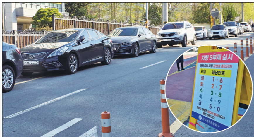
광주 서구청사 앞에 불법주차차된 차량들이 줄지어 있다.

각 구분하기 어려워 차량마다 방문 목적과 신원을 확인하는 과정이 반복되면서 정체가 발생하기도 했다. 홀짝제 시행 사실을 알지 못한 일부 직원들은 청사에 진입하려다 발길을 돌리는 모습도 곳곳에서 목격됐다. 한 직원은 "홀짝제 시행일을 깜박했다"며 "잠시라도 주차할 수 없는지 물었지만 허용되지 않았다"고 말했다. 문제는 청사 주변 골목과 이면도로에서 발생했다. 차량번호 끝자리가 3·8번인 5부제 대상 차량을 운행한 민원인들의 주차가 급증했기 때문이다. 광주 동구 동명동 푸른마을공동체센터 앞 공영주차장과 행정복지센터 주차장 역