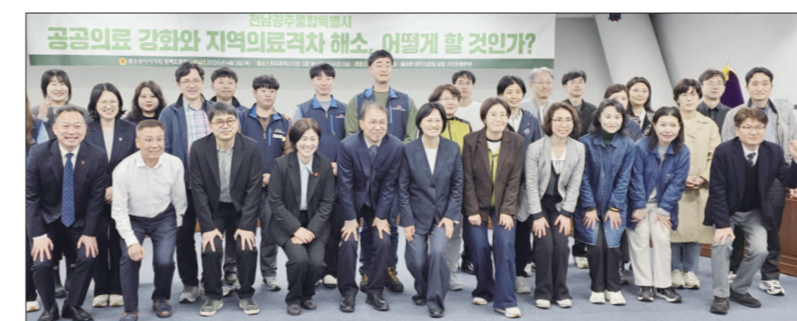
광주시의회는 지난 9일 5층 회의실에서 ‘행정통합과 지방선거 보건 의료의 새로운 여건을 말한다’란 주제로 전남광주특별시 출범 공공의료 정책 토론회를 개최했다.