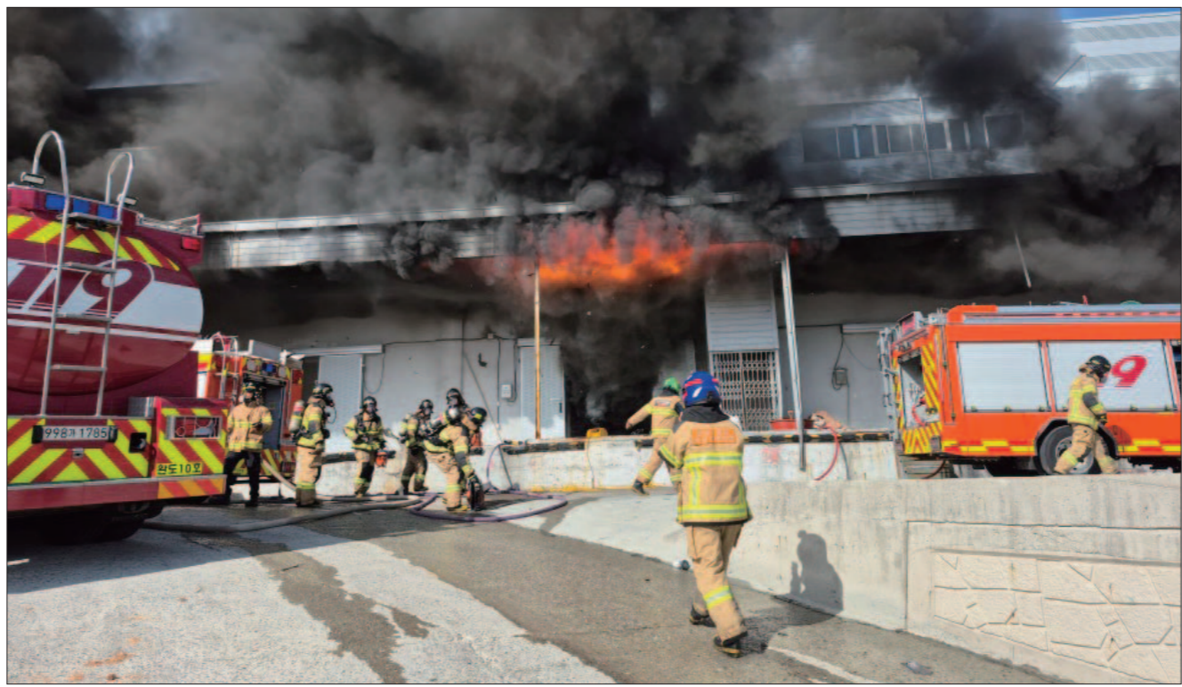
12일 오전 전남 완도군 군외면 한 수산물 가공업체 냉동창고에서 난 불로 내부에 진입하던 소방관 2명이 숨졌다. 사진은 진화와 수색 작업 벌이는 소방당국.

남2녀를 둔 가장이었던 것으로 알려졌다. 함께 희생된 B소방사 역시 최근 웨딩 촬영을 마치고 올해 10월 결혼할 예정이었던 예비신랑이었던 것으로 전해져 안타까움을 더하고 있다. 현장에서는 공장 관계자 1명(59)도 연기를 흡입해 병원으로 이송됐으나 생명에는 지장이 없는 것으로 확인됐다. 이번 화재로 창고 1개 동 대부분이 타거나 그을렸다. 화재는 인력 115명과 장비 39대가 투입된 끝에 오전 11시 26분께 완전히 진화됐다. 이번 사고는 냉동창고 내부 작업 과정에서 시작된 것으로 잠정 파악됐다. 당시 공장에서는 바다 재포장과 평탄화 작업이 진행 중이었으며, 페인트 제거를 위해 사용한 토치에서 불꽃이 발생했다는 진술이 나온 상태다. 특히 바다에 시공된 에폭시 등 가연성 물질과 건물 일부에 사용된 샌드위치 패널 구조가 불길 확산을 키운 요인으로 지목된다. 여기에 천장 등에 채류하던 유증기가 폭발하면서 순식간에 검은 연기와 화염이 확산된 것으로 추정된다.