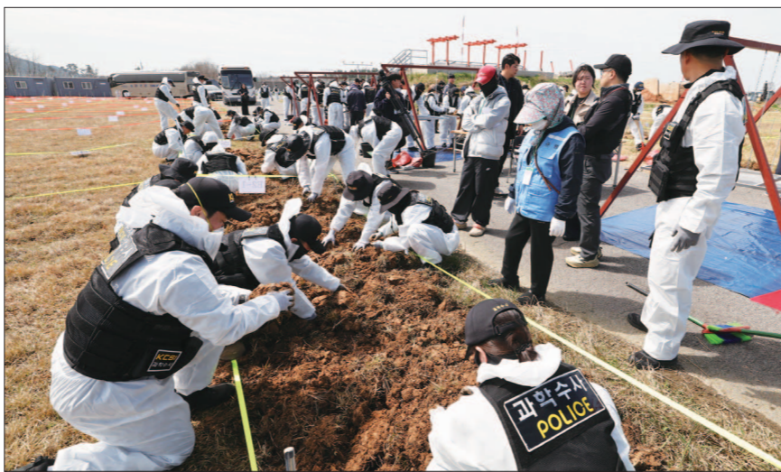
13일 전남 무안국제공항에서 경찰과학수사대가 제주항공 여객기 참사 미수습 유해를 찾기 위해 재수색하고 있다.

일 기준 실제 희생자 유해로 확인된 것만 33점에 이르면서 현장에 미수습 유해가 더 남아 있을 가능성이 제기됐다. 이에 따라 범정부 차원으로 이뤄지는 대대적인 정밀 수색 현장에는 민·관·군·경 합동 약 250명이 매일 투입된다. 세부적으로 경찰청 과학수사대 등 100명, 국방부 유해발굴감식단 등 군 100명, 소방 20명, 사조위·전남도·무안군 공무원과 유가족 등 30명이 수색에 참여한다. 수색에 참여하는 인력들은 현장 합동지휘본부 설치해 운영에 나선다. 지휘본부 아래에는 사조위 사무국장이 전담하는 잔해수색본부, 전남경찰청 형사과장이 도맡는 정밀수색본부, 군이 맡는 외과수색본부, 소방이 맡는 안전구조본부, 국토부 등이 전담하는 수색지원본부