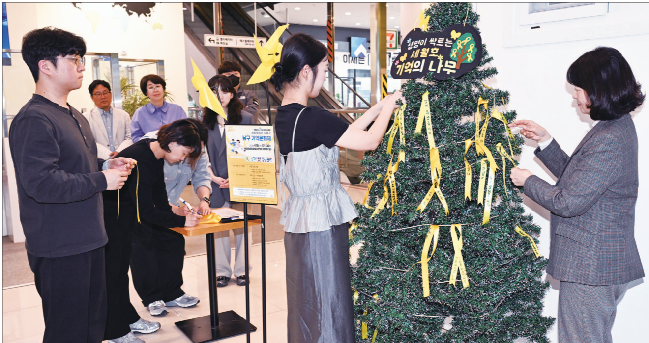
이웃 않겠습니다 세월호 참사 12주기를 사을 앞둔 13일 오후 광주 남구청 1층 로비에 설치된 세월호 기억의 나무에 공무원들과 시민들이 추모 리본을 달고 있다.