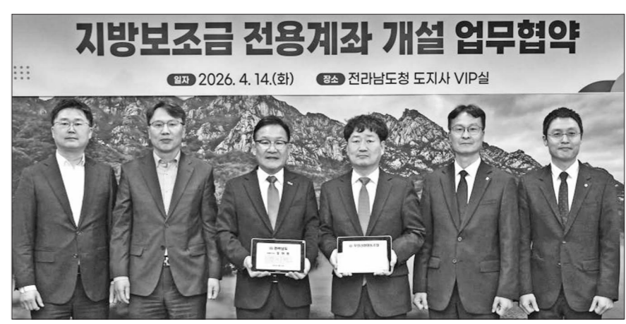
신협중앙회 광주전남지역본부는 14일 전남도, 무안신협과 함께 ‘지방보조금 전용계좌 업무협약’을 체결했다.