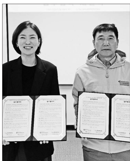
(재) 광주연구원 광주지역경제교육센터는 14일 광주노동권익센터와 광주지역 노동자의 경제·금융 역량 제고 및 안정적인 자립 기반 조성을 위한 업무협약을 체결했다.

3시 30분 기준 원달러 환율은 전날보다 8.1원 내린 1481.2원을 나타냈다. 간밤 뉴욕증시는 3대 주가지수가 동반 상승했다. 지난 13일(미국 동부시간) 뉴욕 증권거래소(NYSE)에서 다우존스30 산업평균지수는 전장보다 301.68p(0.63%) 오른 4만8218.25에 마감했다. 스탠더드앤드푸어스(S&P) 500지수는 69.35p(1.02%) 상승한 6886.24, 나스닥 종합지수는 280.84p(1.23%) 뛴 2만 3183.74에 장을 마쳤다. 미국과 이란의 종전 합의가 결정되면서 워싱턴이 심리가 강한 채로 장을 열었지만, 미국과 이란이 여전히 협의하고 있다 는 기대감에 흐름이 뒤집혔다. 국내 증시도 미국발 훈풍에 반도체 대형주를 중심으로 상승 흐름을 탔다. 삼성전자는 2.74% 오른 20만6500원에 거래를 마쳤다. SK하이닉스는 이날 말 발표 예정인 올해 1분기 실적에 대한 기대감이 더해지며 6.06% 뛴 110만3000원에 장을 종료했다. 양재용 기자 djawody0316@gwangnam.co.kr