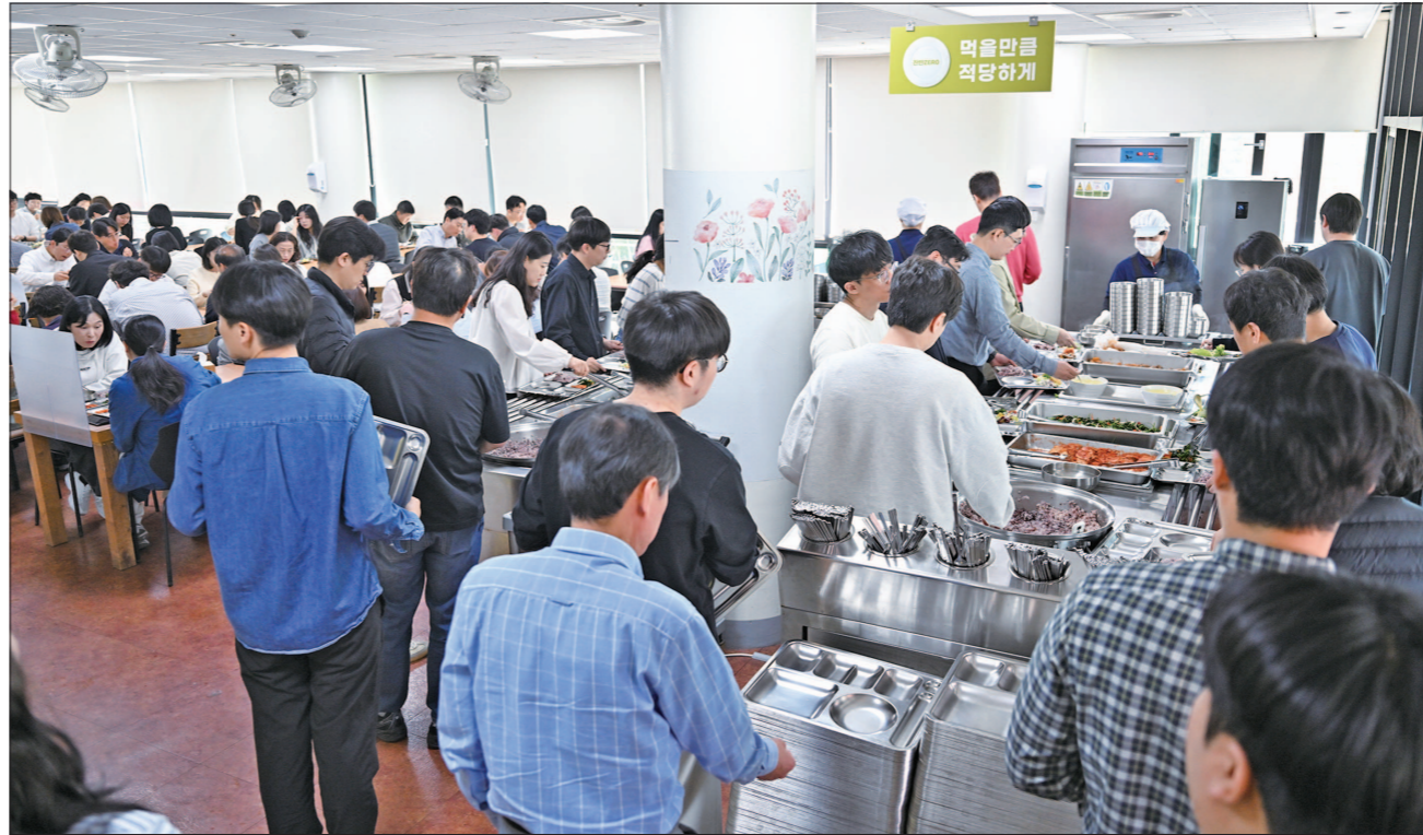
‘3고’(고환율·고유가·고물가) 속 중동 정세 불안 장기화로 ‘런치플레이션’이 심화되면서 식당 대신 구내식당 등으로 향하는 직장인들의 발걸음이 늘어나고 있다. 사진은 서구청사 내 구내식당 모습.