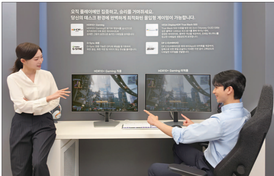
삼성전자 모델이 설명한 화면의 ‘HDR+10 게이밍’과 높은 명암비의 ‘트루블랙’을 적용한 2026년형 OLED 모니터로 게임을 플레이하고 있다.

2026년형 TV 신제품 출시 혁신 AI 기능 콘텐츠 차별화 프리미엄 라인업 전면 개편