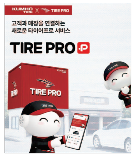
고 매장별 특화된 서비스 운영을 통해 차별화된 고객 경험을 제공할 계획이다.

금호타이어는 타이어프로 플러스를 통해 전국 타이어프로 매장과 온라인 플랫폼을 유기적으로 연결해 고객 접점을 확대하