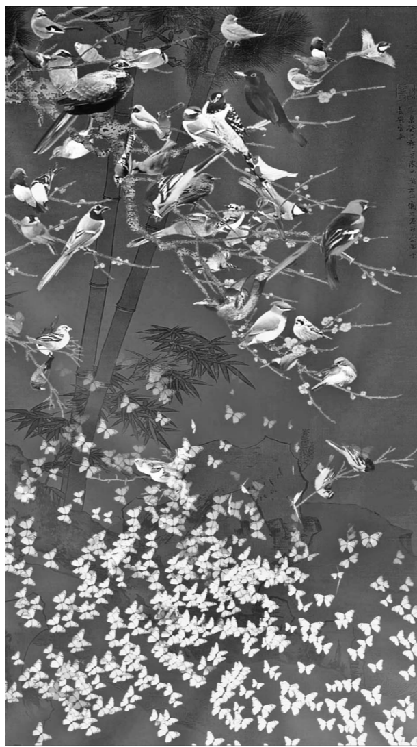
'기운생동 87마리 새'

특히 이번 전시에서는 AI(인공지능)를 활용한 작업들이 눈길을 끈다. '황토농집