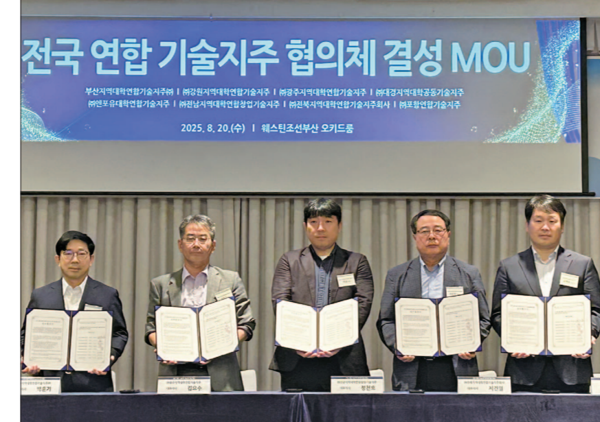
광주지역대학연합기술지주(대표 김요수)는 지난해 전국 8개 연합기술지주사와 함께 협의회를 결성해 전국적인 기술 협력 네트워크를 구축했다.