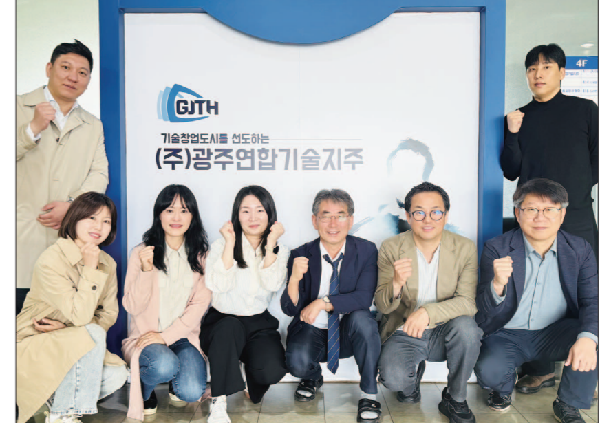
광주지역대학연합기술지주는 지난 2016년 기술 사업화 전문 기관으로 설립해 10여년간 지역 스타트업의 혁신적 아이디어를 실제 사업으로 발전시킬 수 있도록 다양한 자원을 제공하고 있다.