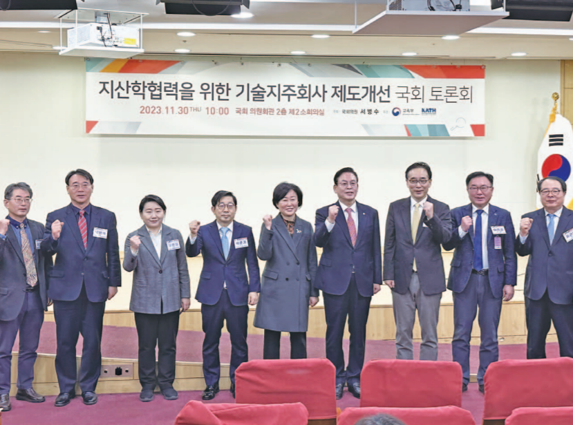
지난 2023년 한국기술지주회사협회와 교육부와 함께 진행된 ‘지산학 협력을 위한 기술지주회사 제도개선 국회 토론회’.

량과 네트워크를 기반으로 유망 스타트업을 추천할 수 있으며 정부는 추천한 기업에 최대 7억원 규모의 R&D 및 사업화 자금을 지원한다. 지난해에는 한국벤처투자(모태펀드)가 주관한 ‘대학창업펀드’(25억 원 규모)에 선정돼 조합을 결성했으며 같은 해 1월에는 과학기술정보통신부 장관으로부터 기술사업화 부문 대상을 수상하기도 했다. 이밖에도 135억원 규모의 펀드를 결성해 지역 창업 기업의 지속성장의 마중물 역할을 하며 투자 기업인 에스오에스랩이 지난해 코스닥에 상장하는 성과도 거뒀다. 향후 광주지역대학연합기술지주는 해외 시장 판로 개척 등 글로벌 시장 진출과 산학협력 거버넌스를 강화해 공공기술 사업화를 더욱 확장할 계획이다. 광주지역대학연합기술지주 관계자는 “이제 단순한 투자 기관을 넘어, 기술과 시장의 간극을 메우는 ‘컴퍼니빌더’로서의 정체성을 확고히 하고 있다”며 “우리는 대학이 가진 혁신 기술이 연구실에 머물지 않고, 실제 산업 현장의 구매 수요와 연결되도록 ‘수요 역설계’ 방식의 창업 생태계를 구축하고자 한다”고 밝혔다. 이어 “지역의 한계를 넘어 글로벌 경쟁력을 갖춘 기술 강소기업을 육성하는 것이 우리의 목표다”며 “투자할 기업을 발굴하는 조직에서 투자할 만한 기업을 만드는 조직으로 도약할 수 있도록 노력하겠다”고 강조했다. 김요수 기자 y1404@gwangnam.co.kr