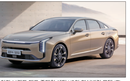
기아 브랜드 대표 준대형 세단 K8의 연식변경 모델 ‘The 2027 K8’ 판매를 시작했다.

기아가 브랜드 대표 준대형 세단 K8 연식변경 모델 ‘The 2027 K8’ 판매를 시작했다. 2027 K8은 고객 선호도가 높은 편의·안전 사양을 기본 적용하고, 가격 경쟁력을 높여 상품성을 강화한 것이 특징이다. 기아는 2027 K8 최상위 트림인 시그니처에 주행 중 시선 분산을 줄이는 헤드업 디스플레이를 기본화해 안전성과 편의성을 향상시켰다. 노블레스 트림과 베스트 셀렉션 트림에는 다양한 첨단 운전자 보조(ADAS) 사양을 확대 적용해 한층 안전하고 편리한 주행 경험을 제공한다. 기아는 노블레스 트림에 고속도로 주행 보조 2, 내비게이션 기반 스마트 크루즈 컨트롤, 후측 승객 알람 등을 기본 적용하고, 베스트 셀렉션 트림에는 후측방 충돌 방지 보조, 후방 교차 충돌방지 보조, 안