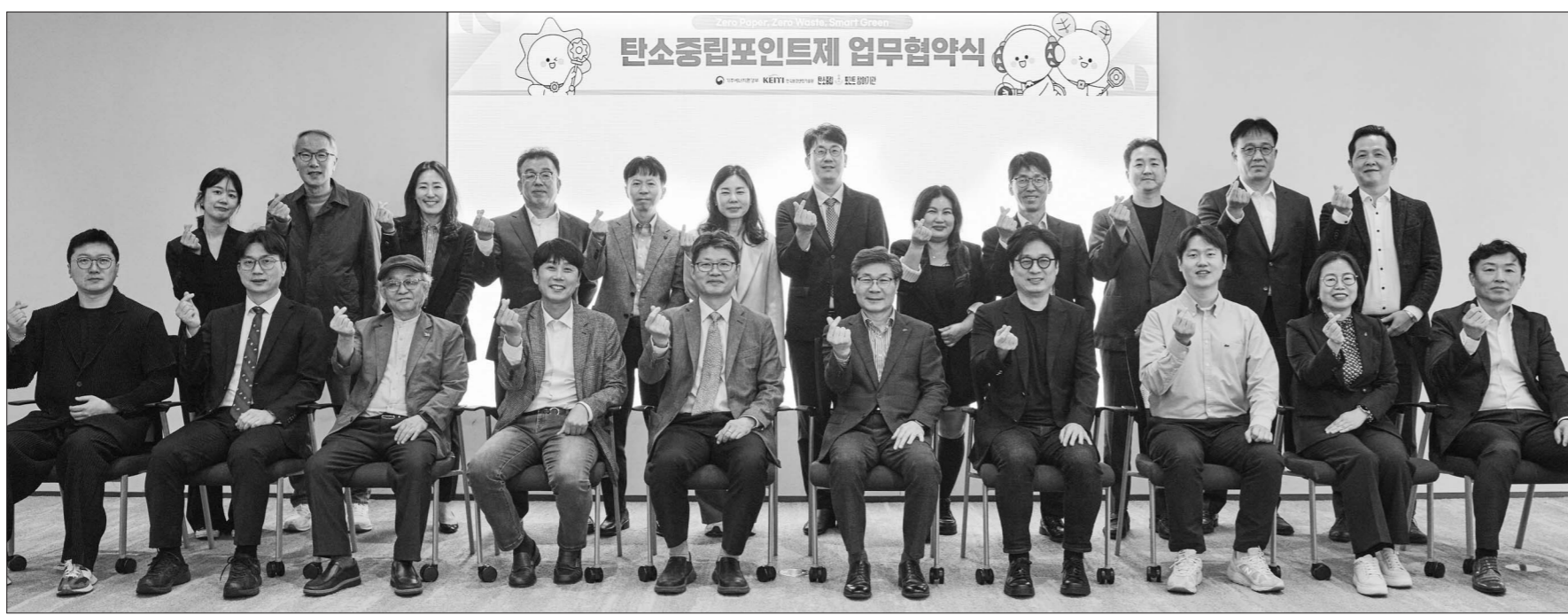
광주시는 22일 서울 중로 센트로폴리스에서 기후에너지환경부, 한국환경산업기술원, 삼성전자서비스 등 22개 기관·기업이 함께 '탄소중립포인트제 녹색생활 실천 분야 확산을 위한 업무협약(MOU)'을 체결했다.

이런 전망과 11차 전기본에 따르면 2038년과 2040년 사이 최대 전력 수요가 2.5GW에서 8.9GW 늘어난다는 것인데 이는 원자력발전소 2~6기 설비용량과 맞먹는다. 12차 전기본 수립 총괄위는 향후 자가용 태양광 발전설비 등 자가용 재생에너지 발전설비 보급과 미래 수소 발전 계획 등을 반영해 수요 전망을 재검토하는 한편 처음으로 지역별 전력 수요 전망을 산출해 내놓을 예정이다.