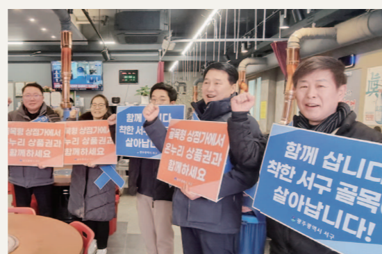
서구 동천동 상인회가 골목형상점가 지정 후 다양한 홍보 활동을 펼치고 있는 모습