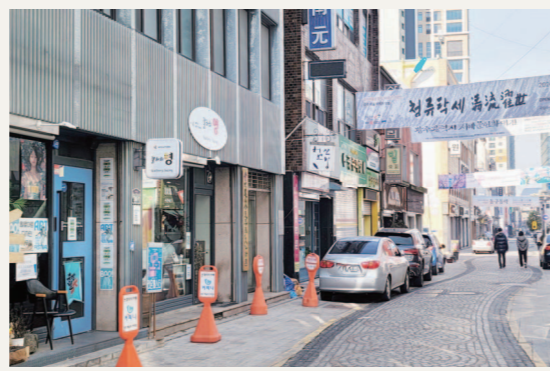
광주 동구 제1 골목형상점가로 지정된 '예술의 거리'의 모습