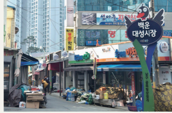
광주 남구 제1 골목형상점가로 지정된 백은대성시장에 백은동을 대표하는 기치 캐릭터 조형물 안내판이 설치된 모습