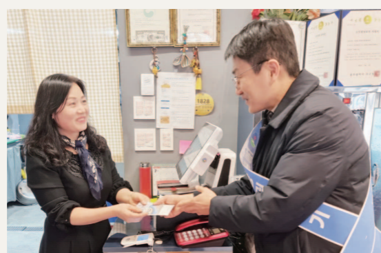
서구 치평동 음식문화의 거리 골목형상점가 일원에서 '민생경제 회복을 위한 소비촉진 캠페인'을 펼치고 있는 모습