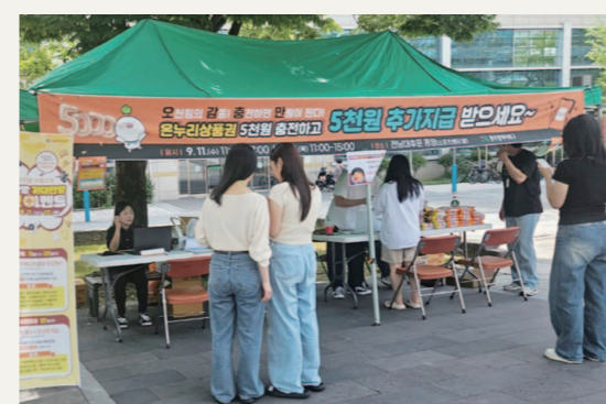
전남대학생들을 대상으로 온누리상품권 마케팅을 진행하고 있는 모습