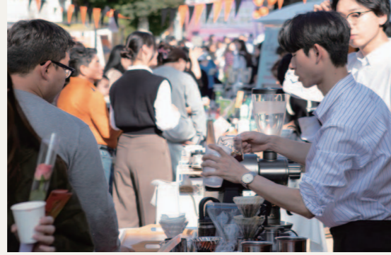
지난해 광주 동구 동명동 카페거리와 여협사의 ZIP(지) 일원에서 열린 '제4회 동명커피산책'의 모습