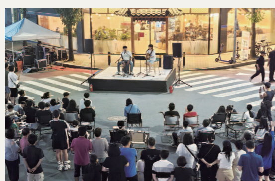
광산구 첨단지구 골목형상점가가 진행한 '제1회 광산허터락 페스티벌' 공연을 보고 있는 시민들의 모습