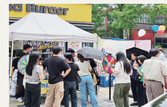
전남대 후문 공동 마케팅 행사에 참여한 시민들이 경품 돌림판을 돌리고 있는 모습