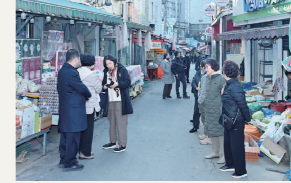
남구 백은 대성시장에서 주민들이 물건을 구매하는 모습