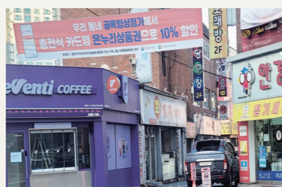
지난 2021년 광산구 '제1회 골목형상점가'로 지정된 산정상인회 골목형상점가의 모습