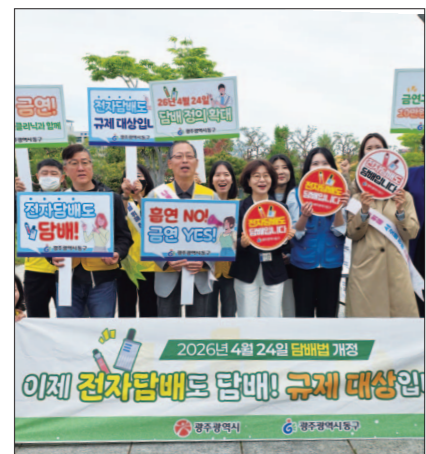
광주 동구와 광주금연관리지원센터는 23일 조선대학교 장미원과 조선대병원에서 ‘전자담배도 담배’ 캠페인을 진행했다.