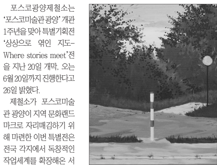
서영기 작 'Boundaries (경계)'

포스코광양제철소는 '포스코미술관 광양' 개관 1주년을 맞아 특별기획전 '상상으로 엮인 지도-Where stories meet' 전을 지난 20일 개막, 오는 6월 20일까지 진행한다