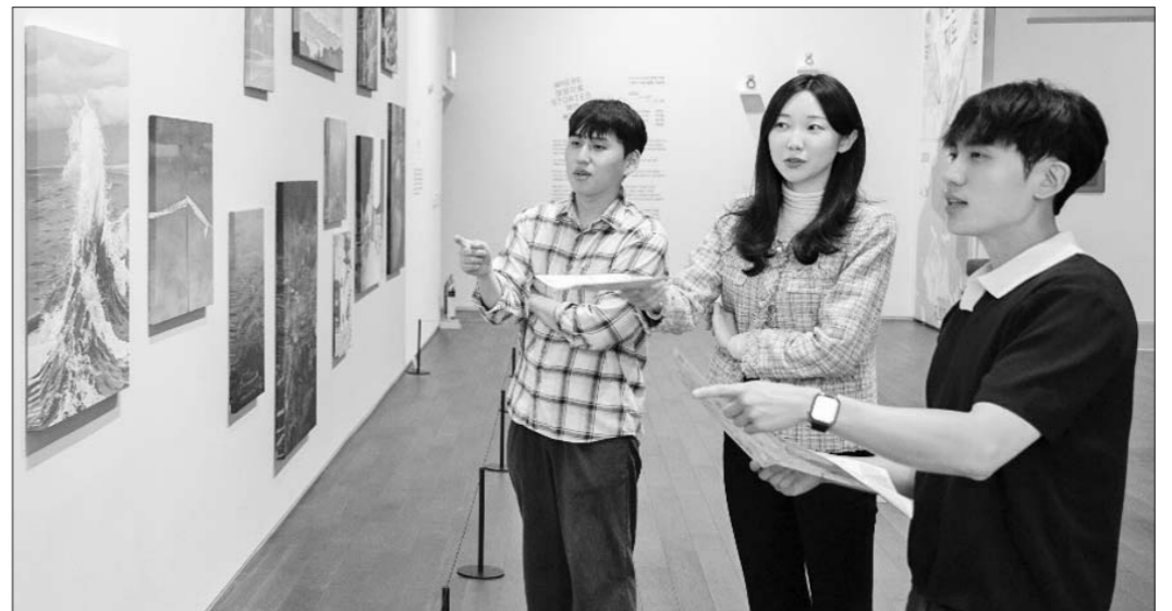
포스코광양제철소가 '포스코미술관 광양' 개관 1주년을 맞아 특별기획전 '상상으로 엮인 지도-Where stories meet' 전을 지난 20일 개막한 가운데 방문객들이 특별기획전을 관람하고 있다.