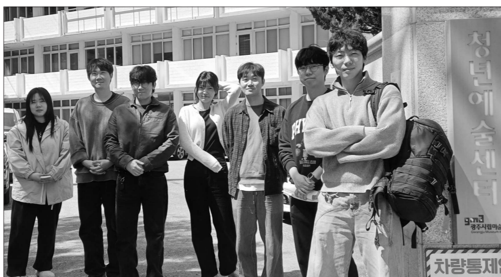
청년예술센터에서 포즈를 취하고 있는 창작 레지던시 입주 작가들.