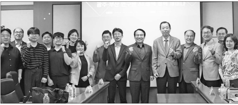
광주연구원은 최근 부산연구원에서 '남부 경제권 영호남 거점도시 정책연구원 연구 협력 기반 강화 세미나'를 개최했다.

이를 위한 전략으로는 비즈니스·기술·인재를 3대 핵심 축으로 설정하고, 국제 자유 비즈니스도시, 디지털 첨단 산업도시, 글로벌 문화관광도시, 글로벌 교육도시 등 4대 방향을 제시했다. 발표 이후에는 남북 경제권 구축과 권역별 매개도시 조성 방안을 둘러싸고 지역 전문가들 간 심도 있는 토론이 이어졌다.