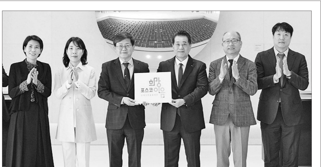
포스코그룹은 최근 산업재해 노동자와 가족의 조속한 사회복귀를 지원하기 위한 산재가족돌봄재단 '포스코 희망이음'을 출범시켰다.

방 캠페인, 재난 대응 훈련 참여와 같은 산업 현장의 실무경험을 제공하고 활동실적이 우수한 단원에게는 다양한 보상과 인센티브를 제공한다. 항만공사는 지난해 국민안전점검단을 통해 국민 제감형 안전 위험요소 9건을 발굴, 개선 조치했다. 최관호 항만공사 사장은 "여수·광양항의 안전은 항만 경쟁력의 출발점이자 중추점"이라며 "국민안전점검단 활동을 통해 국민의 목소리를 직접 듣고 모두가 안심하고 이용할 수 있는 항만 만들기를 위해 노력하겠다"고 말했다. 광양=김귀진 기자 kkinjin@gwangnam.co.kr