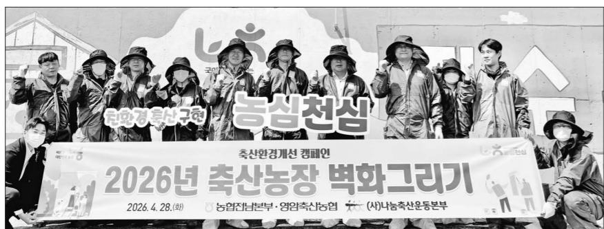
농협 전남본부는 28일 영암군 군서면 한우 농가를 찾아 '에쁜 농장 벽화그리기' 행사를 진행하며, 축산농가 외부 환경 정비를 통한 인식 개선 활동을 펼쳤다.

방식 점검 △현장 감독자의 안전관리 책임 이행 여부 등을 집중적으로 살폈다. 아울러 '3심(같은 마음가짐으로, 함께 협심하며, 주변에 관심 갖기)' 정신을 바탕으로 임직원 모두가 자발적으로 안전 확보에 참여하는 '무사고·무재해 사업장' 조성을 강조했다. 편지형 검사국장은 "작은 방심이 큰 재해로 이어질 수 있는 만큼 철저한 주의가 필요하다"며 "근로자는 물론 농협 시설을 이용하는 고객 모두의 안전을 위해 위험요인을 지속적으로 점검하고 개선해 나가겠다"고 말했다. 이승홍 기자 photo25@gwangnam.co.kr