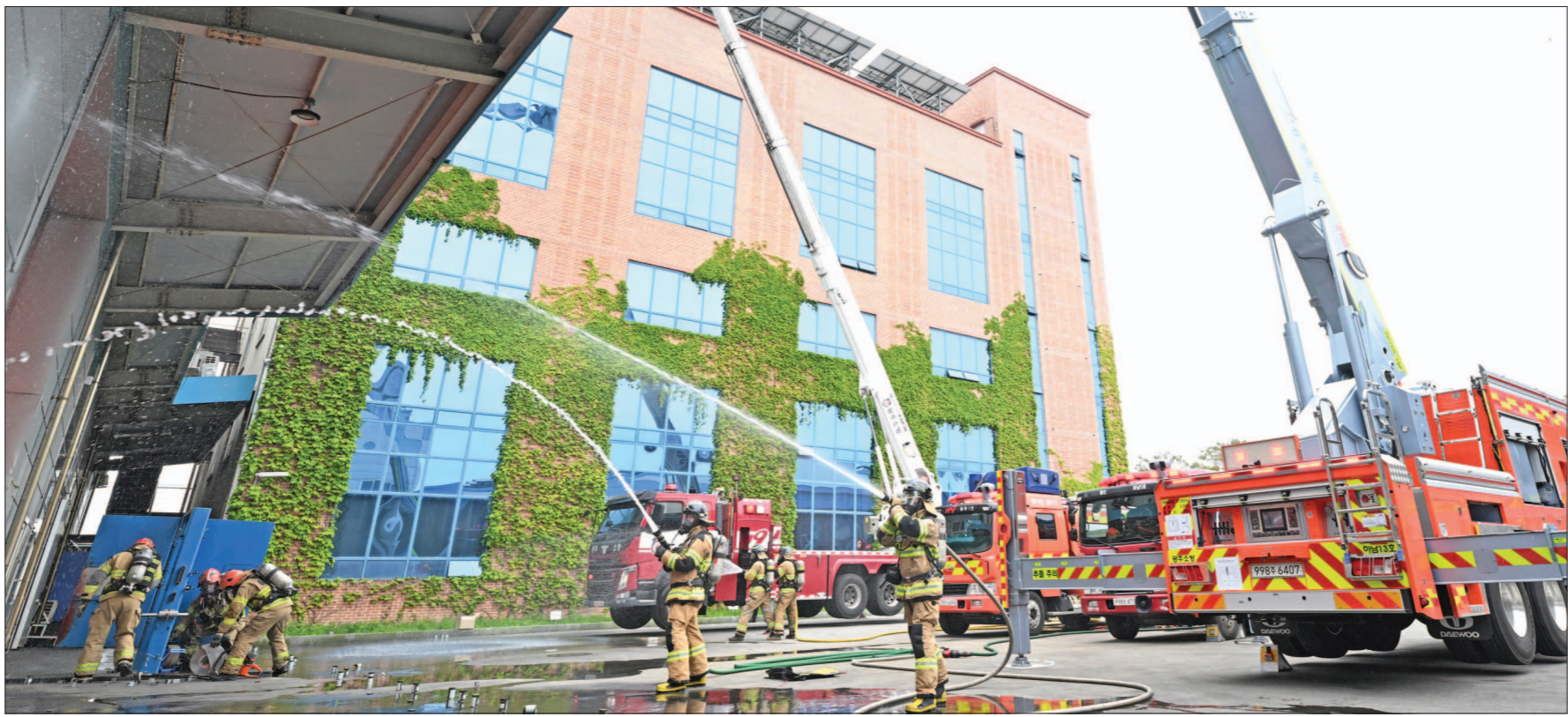
최근 광주 광산구 장덕동 ㈜호원 하남공장에서 실시된 '2026 광주구 긴급구조 종합훈련'에서 광산소방 대원들이 화재 진압을 하고 있다. 이날 훈련은 대형 화재와 건물 붕괴 등 복합 재난 상황을 가정해 실시됐으며 광산소방서, 광산구청, 전남대학교병원 등 16개 기관·단체와 장비가 투입됐다.

광산 하남산단 ㈜호원 공장 ‘화재+붕괴’ 복합 재난 가정 초기진화부터 인명구조까지 16개 유관기관·단체 등 참여