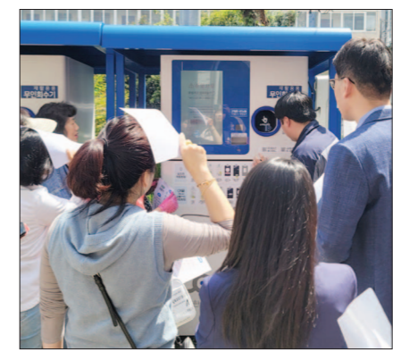
AI 무인회수기 수거 모습

남구는 AI 무인회수기 운영 효율을 높이기 위해 포인트 적립형 보상 시스템도 도입했다. 이용자가 캔 또는 페트병을 투입하면 1개당 일정 포인트를 지급하는데, 누적 포인트는 현금으로 환급받을 수 있어 주민들의 큰 호응을 얻고 있다. 그 결과 최근 3년간(2023~2025년) AI 무인회수기의 재활용률 수거량은 해마다 늘고 있다. 2023년 캔 131만9027개와 페트병 725만5214개 수거를 시작으로, 2024년에는 캔과 페트병을 각각 148만1155개와 942만1206개, 지난해는 캔 136만8140개와 페트병 928만5842개를 수거한 것으로 집계됐다.