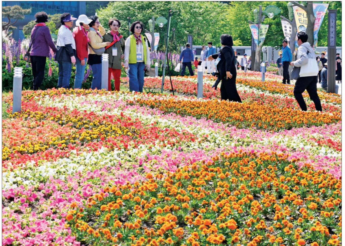
꽃길을 걸으며 어린이날 휴일을 맞아 5일 오후 전남 함평엑스포공원에서 열린 함평나비대축제장을 찾은 나들이객들이 형형색색의 활짝핀 꽃길을 걸으며 봄기운을 만끽하고 있다. ‘꿈꾸는 나비, 시작되는 여정’을 주제로 열린 제28회 함평나비대축제는 아르메니아, 메리골드 등 29종의 초화류 90만본과 긴꼬리제비나비, 배추흰나비, 호랑나비 등 23종 25만마리의 나비, 곤충을 한자리에 선보였다.