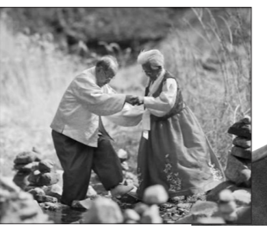
‘남아, 그 강을 건너지 마오’