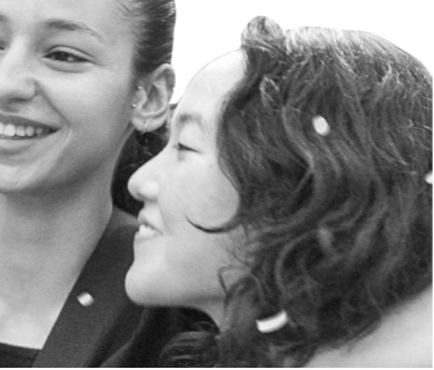
‘파티마가 사랑한 계절’