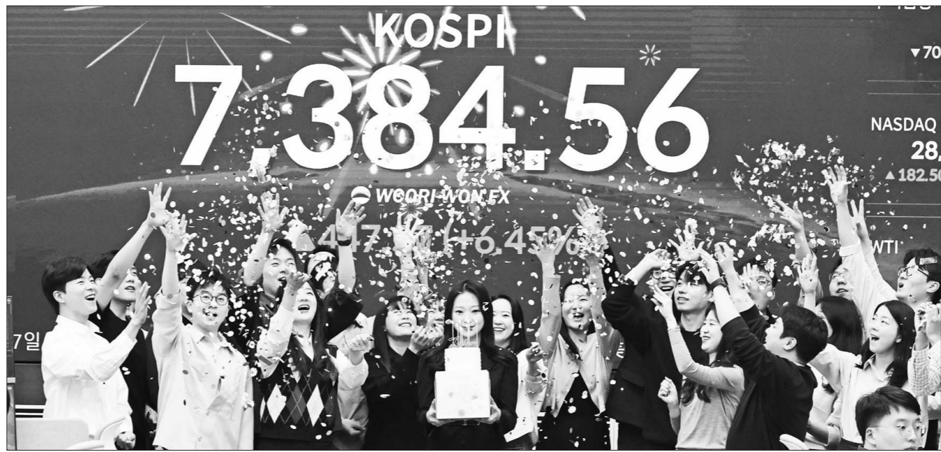
코스피가 사상 처음으로 증가 기준 7000선을 돌파하며 장을 마친 6일 오후 서울 중구 우리은행 본점 딜링룸에서 직원들이 케이크를 들고 축하 세리머니를 하고 있다.

카)가 약한 달만에 발동되기도 했다. 유가증권시장에서 외국인 합계 순매수액은 3조1346억원으로 집계됐다. 이는 역대 최대 순매수 기록이다. 기관과 개인은 각각 2조3090억원과 5760억원을 순매도했다. 삼성전자와 SK하이닉스는 이날 외국인 순매수 상위종목 1위와 2위를 나란히 차지했다. 외국인은 삼성전자를 3조968억원, SK하이닉스를 2673억원 순매수했다. 외국인은 삼성전자와 SK하이닉스가 속한 코스피 전기·전자 업종에서도 3조9102억원 매수 우위를 보이며 집중적으로 쓸어 담아 갔다. 기관 역시 2조6341억원을 순매수했으나 개인은 6조4707억원 매도 우위를 보였다. 삼성전자는 전장보다 14.41% 오른 26만6000원으로 마감하고 SK하이닉스는