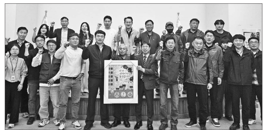
한국농어촌공사 나주시지사는 지난 6일 나주시사 대회의실에서 공사감독 및 현장대리인 등 40여명이 참석한 가운데 ‘2026년 경기 건설현장 안전회의 및 안전교육’을 개최했다.