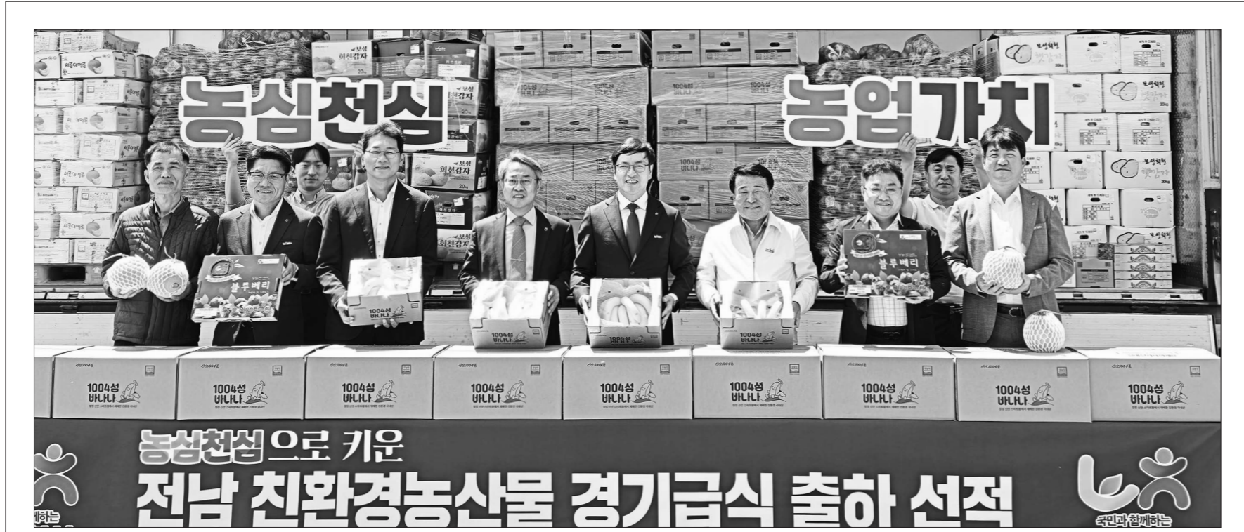
농협 전남본부는 7일 농협 호남권친환경농산물종합물류센터에서 경기도 학교급식용 친환경 농산물 출하식을 개최했다.