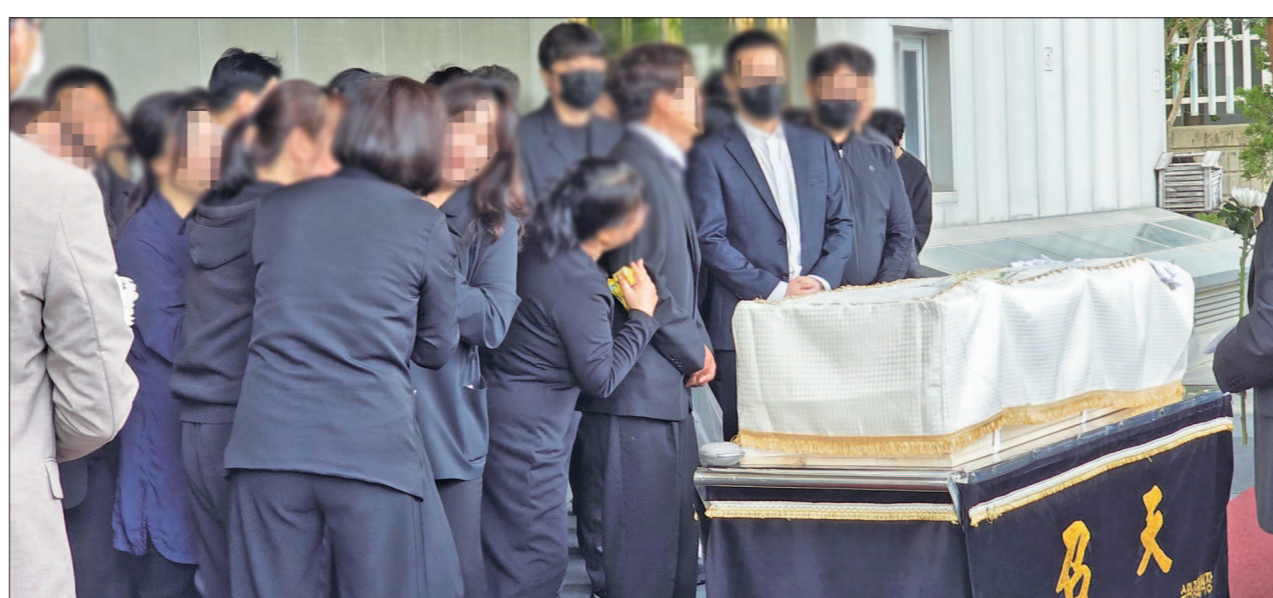
지난 5일 귀장길 흥기피습으로 사망한 고등학교생 A양(17)의 발인식이 엄수된 7일 광주 광산구의 한 장례식장에서 유족들이 오열하고 있다.

“이렇게 보낼 수 없어. 엄마는 어떻게 살라고...” 한밤중 불의의 사고로 숨진 A양(17)이 떠나야 할 시간이 다가오자 장례식장 복도와 출입구 주변은 무거운 분위기가 감돌았다. 유족들은 차마 떠나보내지 못한 채 관을 붙잡고 오열했고, 친구와 교사들도 눈물로 마지막 등굣길을 배웅했다. 7일 오전 8시 광주 광산구 신가동의 한 장례식장. 검은 옷차림의 유족들은 침통한 표정으로 빈소를 지켰다. A양의 부모는 수척한 얼굴로 영정사진을 바라보며 연신 눈물을 흘렸고, 뒤늦게 빈소를 찾은 조문객들은 유족의 손을 잡으며 애도의 뜻을 전했다. 발인 시간이 다가오자 장례식장 밖에