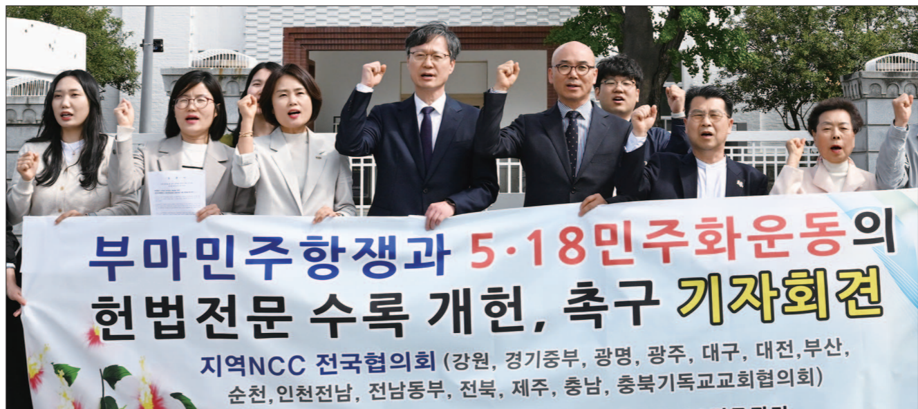
광주NCC(한국기독교교회협의회) 회원들이 최근 광주 동구 5·18민주광장에서 열린 기자회견에서 부마민주항쟁과 5·18민주화운동의 헌법전문 수록 개헌을 촉구하며 구호를 외치고 있다.

독재에 맞서 민주주의를 지켜낸 역사”며 “그 정신을 헌법에 새기는 일은 선택이 아니라 반드시 이행해야 할 역사적 책무이다”고 피력했다. 추진위는 국회 개헌안 의결 불성립의 책임은 전적으로 정치권에 있다고 지적했다. 단체는 “무엇보다 국민의힘은 끝내 표결에 참여하지 않았다. 이는 국민의 요구를 외면한 책임 회피이며, 낡은 헌정 체계를 주권자 국민의 요구에 맞게 새롭게 재정비할 기회를 스스로 거부한 선택이다”며 “특히 12·3 사태 이후 무너진 헌정질서 회복과 단절 의지를 보여줄 기회였음에도 이를 행동으로 입증하지 못한 점에서, 그 정치적 책임은 더욱 무겁다”고 말했다. 또 “이러한 선택은 스스로의 개혁 의지와 책임성을 국민 앞에 증명하지 못한 것으로 평가될 수밖에 없다”며 “더불어민주당을 비롯한 다수 의석을 가진 정치세력 역시 개헌을 추진할 의지가 있었다면 보