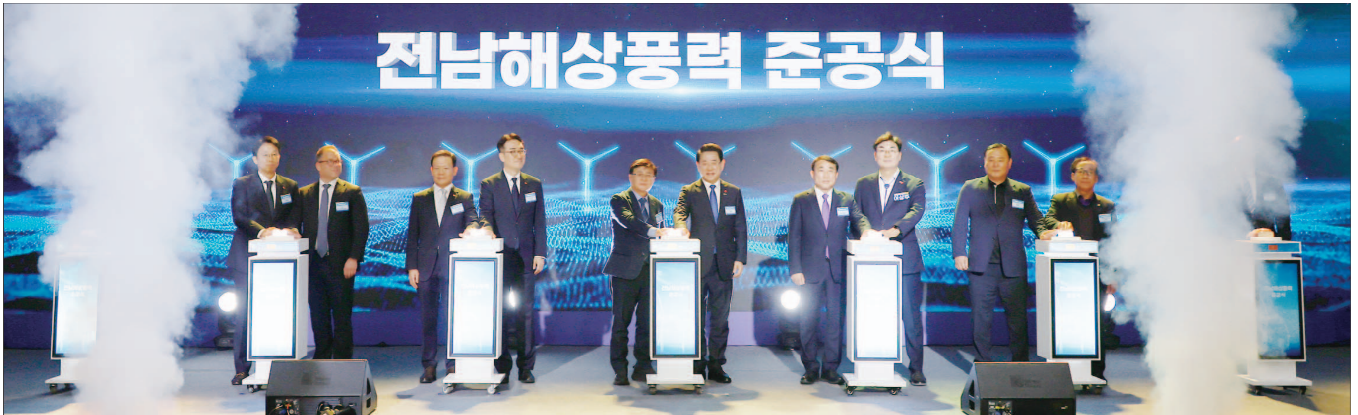
지난해 12월 신안 라마다호텔&싸리리조트에서 국내 최초 민간부분 96MW 규모의 전남해상풍력 준공식이 열리고 있다.