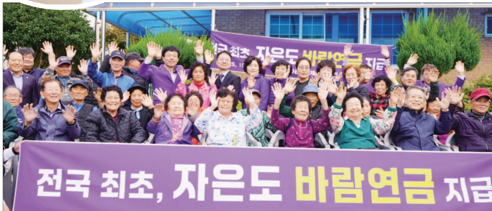
2025년 10월 자은면 주민들이 국내 최초 바람연금을 지급받고 있다.