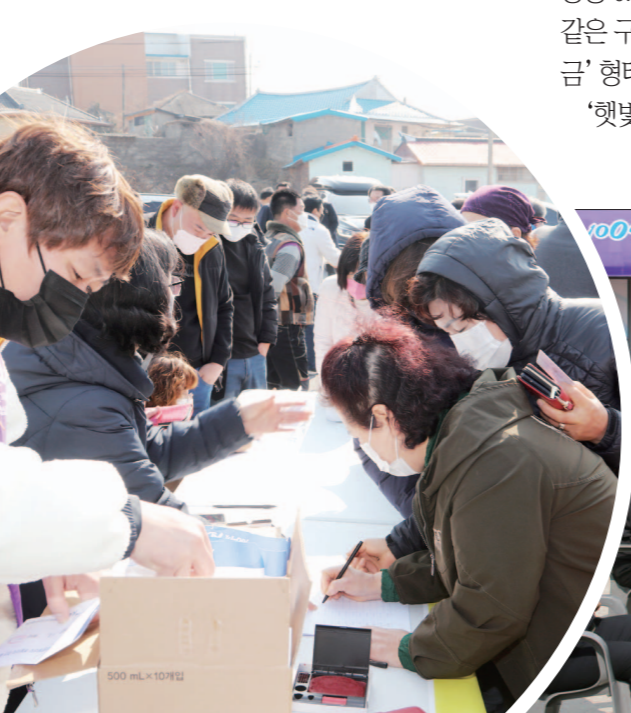
2021년 3월 신안군 안좌면에서 신재생에너지 협동조합 개소식을 개최했다.

실제 햇빛연금의 경제적 파급효과는 크다. 한국은행 산업연관표 분석에 따르면 햇빛연금 220억원, 지급을 통해 생산유발 378억원, 부가가치 184억원, 고용 678명, 소비유발 352억원 등 지역경제 전반에 걸쳐 효과가 나타나고 있다. 연금 지급 이후 관내 하나마트 매출이 30.3% 증가하는 등 소비 유입이 확인됐고, 자영업 매출과 고용 지표도 개선됐다.