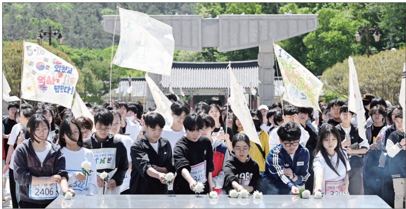
추모 물결 지난 8일 광주 북구 운정동 국립 5·18 민주묘지를 찾은 광주 각화중학교 학생들과 교직원, 학부모들이 한화·분향하고 있다. 제46주년 5·18 민주화운동 기념일을 앞두고 열린 '5·18민주화운동 오월길 마라톤'과 '대행진'에 참가한 각화중학교 전교생, 학부모, 교사 등 300여명은 석곡동 행정복지센터 입구 삼거리부터 5·18 민주묘지까지 오월길 영혼 로드를 함께 달리고 걸으며 그날의 의미를 되새기고 민주주의를 직접 몸으로 체험하고 있다. 각화중학교는 지난 2022년부터 매년 '5·18민주화운동 오월길 마라톤'과 '대행진' 행사를 개최하고 있다.

인공지능(AI) 기술을 악용한 허위 사진·영상물 범죄가 전국적으로 확산하는 가운데 광주·전남에서도 관련 피해 사례가 잇따르면서 시민 불안이 커지고 있다. 정치인 합성사진 유포부터 미성년자를 겨냥한 딥페이크 성범죄까지 범형 유형도 갈수록 다양해지는 양상이다. 광주경찰청은 10일 이재명 대통령의 방일 사진에 '윤석열 사형 구형 속보' 자막을 합성해 인터넷 사이트 등에 게시한 혐의(업무방해·저작권법 위반)로 30대 A씨를 검거했다고 밝혔다. A씨는 지난 1월 한 방송사의 뉴스 자막 화면에 당시 방일 중이던 이 대통령의 드림 합성 사진을 합성해 온라인에 게시한 혐의를 받고 있다. 이후 추가로 4개의 허위 이미지를 제작·유포한 혐의도 적었다. 경찰 조사 결과 무죄인 A씨는 정치권과 직접적인 연관은 없는 것으로 파악됐으며, 관련 전과도 없는 것으로 확인됐다. A씨는 경찰 조사에서 "재미삼아 범했다"는 취지로 진술한 것으로 전해졌다. 법원에서는 AI 딥페이크 영상 제작·유포 범죄에 대한 처벌도 잇따르고 있다. 최근 광주지법 형사12부(재판장 장우석)는 성폭력범죄의 처벌 등에 관한 특례법 위반(허위영상물 편집·배포), 협박 등의 혐의로 기소된 B씨에게 징역 5년을 선고했다. B씨는 2023년부터 지난해 11월까지 전