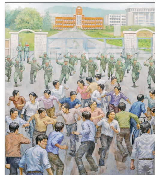
1980년 5월18일 전남대 정문에서 벌어진 학생들과 계엄군 충돌 장면을 복원한 그림.

된다. 이와 함께 총동창회 70년 사진전시회가 오는 13일부터 6월12일까지 전남대 스토리움에서 열리며, 창립 70주년 기념식은 16일 전남대 옹봉홀에서 개최된다. 총동창회는 또 '70년사' 증보판 발간과 공식 SNS 채널 운영 등을 통해 동문과 재학생 소통에도 나설 계획이다. 한편 전남대학교총동창회는 1956년 7월8일 동구 학동 의과대학 대강당에서 창립총회를 열고 출범한 국내 최초 국립대학 총동창회다. 김인수 기자 joinus@gwangnam.co.kr