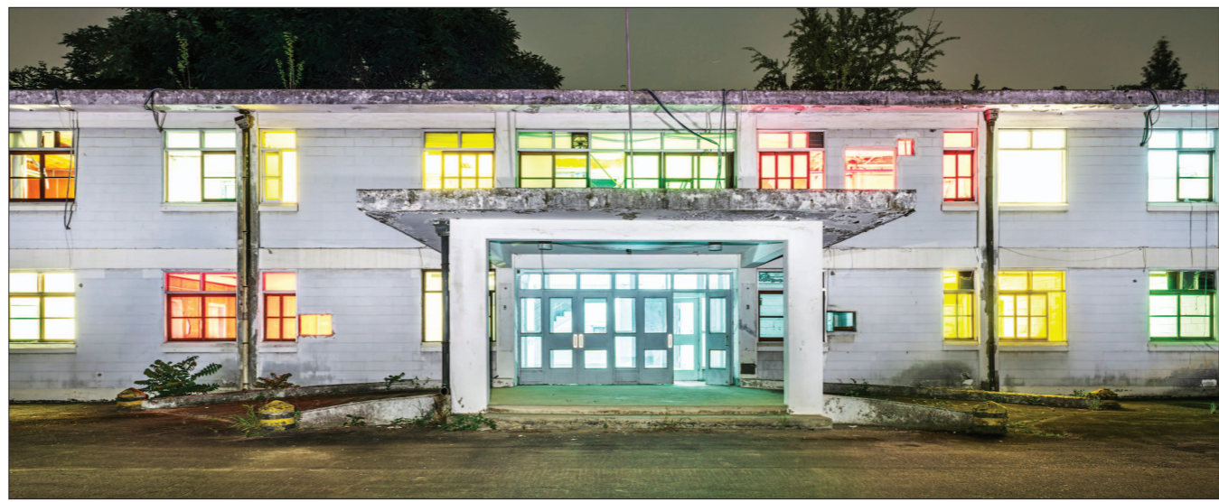
이세현 작 '푸른 빛 붉은 밤' 옛 국군광주병원 ('기억의 출발: 휴먼지가 가라앉은 뒤') 전

7월 15일까지 1~3전시실에서 열리는 5·18기념 미디어아트 첫번째 특별전에서 단연 눈길을 붙잡고 있는데다 전시장을 반드시 방문하고픈 욕망을 자극하는 작품으로 손색이 없다. “완전한 것들의 틈”이라는 주제로 진행된 이번 전시에서 '민중해방운동사'는 틈에 놓인 존재와 같았다. 원작이 소실됐기 때문에 더더욱 그렇다. '민중해방운동사'는 갑오농민 동학혁명에서부터 일제강점기 항일무장투쟁, 해방 후 한국전쟁, 4·19혁명, 5·18민중항쟁, 6월 항쟁 등 1980년대 후반까지 한국 근현대사의 주요 민중해방운동 과정을 망라, 총 120년의 역사가 담겨 서사시 같은 작품으로 평가를 받고 있다. 민중미술사에서 언급하지 않고는 안되는 중요 지점에 놓여 있는 작품이다. '민중해방운동사'는 1988년 12월 민중미술운동전국연합 건설준비위원회