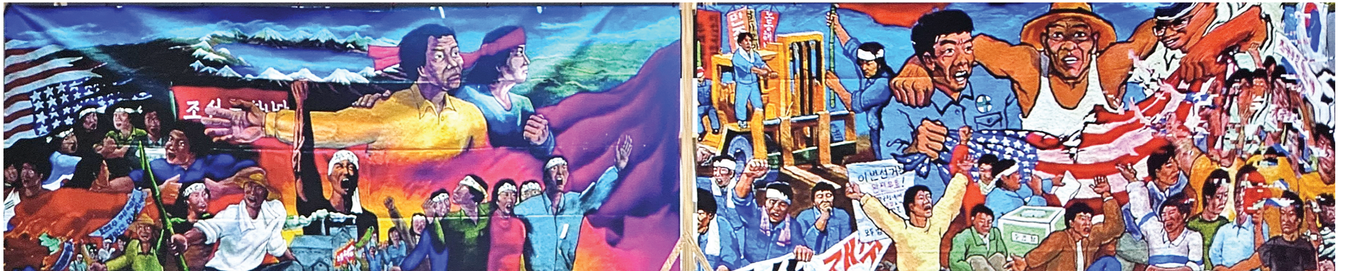
몰입형 미디어아트 작품 '민중해방운동사' (촬영본 일부, '완전한 것들의 틈' 전)