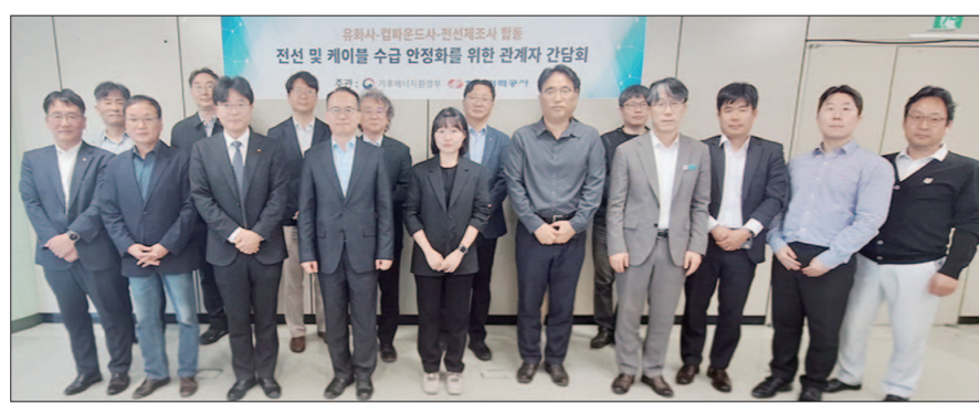
한국전력은 최근 서울 한전 아트센터에서 기후에너지환경부와 전선·석유화학 업계 관계자들이 참석한 가운데 ‘전력 기자재 수급 안정 및 원자재 공급 현황 간담회’를 개최했다.

이번 간담회에서는 중동 정세 불안 이후 급등한 원자재 가격 대응 방안이 집중 논의됐다. 실제 전선 주요 원재료인 나프타와 유가 상승 영향으로 전선 원자재 가격