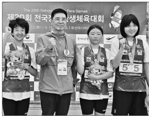
여자 1500m T20(중) 경기에서 입상에 성공한 전남 육상 선수단.

이 적지 않다. 광주에 이번 경기는 단순한 승점 이상의 의미를 가진다. 인천전을 마친 뒤 약 한 달 반 동안 월드컵 휴식기에 돌입한다. 이후 재제가 풀리는 여름시장이 열리는 만큼 전력 보강과 함께 젊은 선수들의 성장이 절실한 상황이다. 휴식기 전 최대한 승점을 확보해야 후반기 반등 가능성도 커질 수 있다. 선수단 역시 반드시 전반기를 승리로 마무리해 분위기 전환을 위한 발판을 마련하겠다는 각오다. 부담 없는 일정 속에서 총력전을 준비하며 강한 투지를 다지는 중이다. 광주는 최근 살아난 수비 집중력을 앞세워 인천 공략에 나선다. 첫 승의 기억이 있는 인천을 상대로 다시 한번 웃으며 전반기를 마칠 수 있을지 관심이 쏠린다. 송하중 기자 hajong2@gwangnam.co.kr