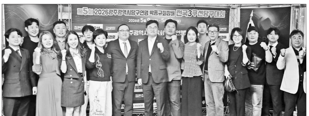
광주시당구연맹이 주최한 '박종규 회장배 전국 3쿠션 당구대회'가 지난 9일부터 10일까지 광주 광산구 흑석동 국제당구장에서 열렸다.

광주시당구연맹이 주최한 '박종규 회장배 전국 3쿠션 당구대회'가 지난 9일부터 10일까지 이틀간 광주 광산구 흑석동 국제당구장에서 성황리에 열렸다. 이번 대회에는 연맹 임원진과 전국 각지에서 참가한 선수단 1200여명, 진행요원 및 내외빈 등을 포함해 총 1400여명이 함께하며 뜨거운 열기를 보였다. 행사에는 정준호 국회의원과 전갑수 광주시체육회장 등도 참석해 선수들을 격려했다. 대회 우승은 김명일이 차지했다. 김명일은 결승에서 뛰어난 경기력을 선보이며 우승 트로피와 함께 상금 2000만원을 거머쥐었다. 준우승은 이성의가 기록하며 상금 500만원을 받았다. 공동 3위에는 조원우 선수와 김우현 선수가 올라 각각 230만원의 상금을 수상했다.