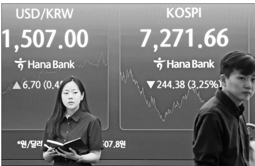
19일 오후 서울 중구 하나은행 전광판에 원/달러 환율과 코스피, 코스닥 지수가 표시돼 있다. 이날 코스피는 전장보다 244.38p(3.25%) 내린 7271.66에 거래를 마쳤다.