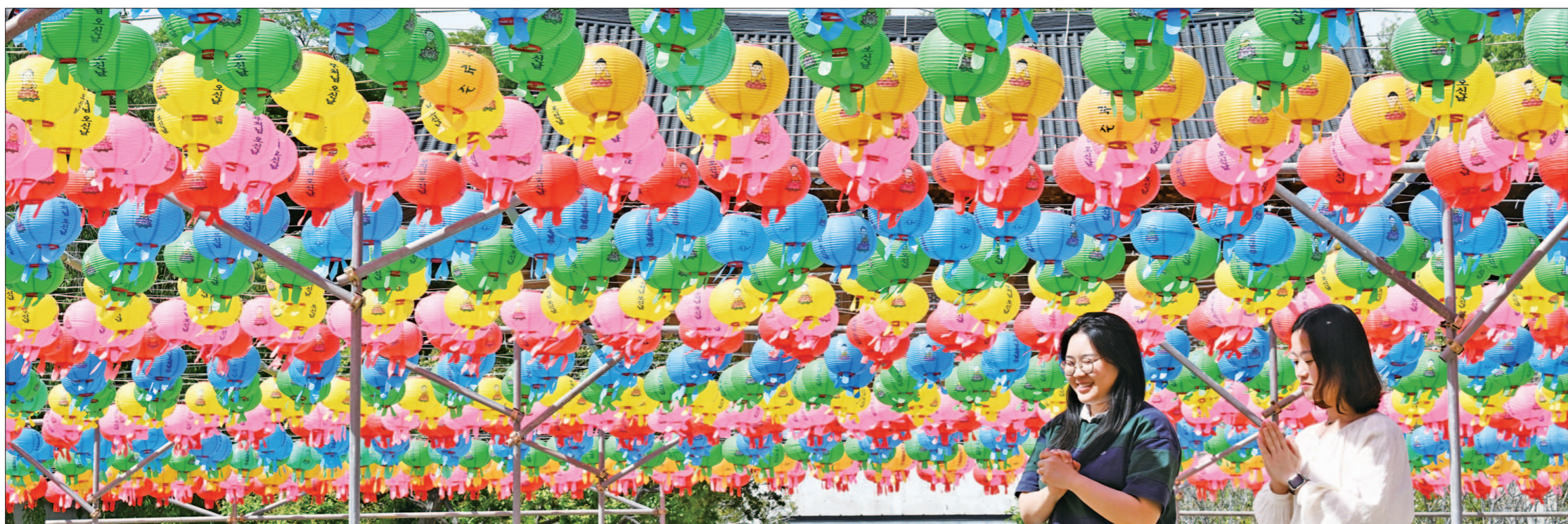
오색연등 아래 불기 2570년 부처님 오신날을 앞두고 19일 오후 광주 서구 치평동 무각사를 찾은 불자들이 오색연등 아래에서 합장을 하고 있다. 오색 연등은 부처님의 탄생을 기리고 지비와 지혜의 빛으로 세상을 밝히는 의미를 담고 있으며 정성 이 담긴 연등은 크기와 상관없이 간절한 마음 그 자체를 소중히 여기는 뜻이 있다.