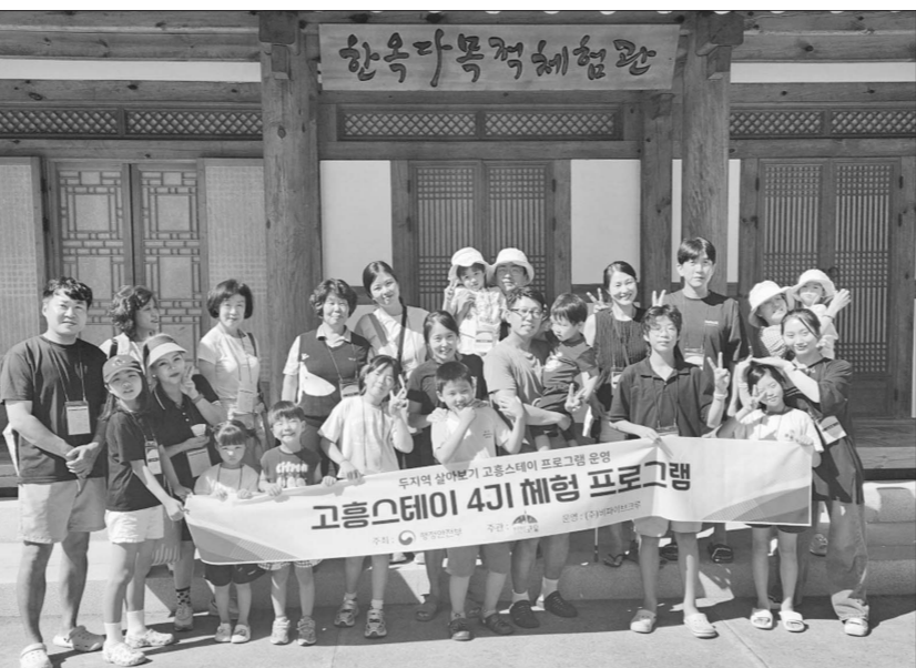
고흥군은 2023년도 행정안전부 공모사업으로 추진한 ‘두 지역 살아보기 고흥스태이’를 1기부터 6기까지 운영을 완료했다. 사진은 고흥스태이 체험프로그램 모습.

돼 연간 800명 이상의 생활인구가 고흥을 체험하는 성과를 거뒀다. 특히 단기 체류 전입자는 38명(전입률 약 16.8%)에 달하며, 이 중 2명은 귀농귀촌으로 정착을 완료해 고흥스태이 프로그램이 단순 관광 유치를 넘어 실질적인 인구 유입 성과로 이어지고 있음을 입증했다. 지역경제 측면에서도 체류 기간 중 세대당 식비, 교통비, 지역 특산물 구매, 체험활동 등 평균 160만원을 소비했으며, 가족 단위 참가자의 경우 실제 소비액은 더욱 많은 것으로 나타났다. 이를 기반으로 추산한 연간 지역경제 파급효과는 입주자 기준 7700만원, 지인 방문객 기준 5800만원으로 연간 총 1억5000만원에 달할 것으로 예상된다.