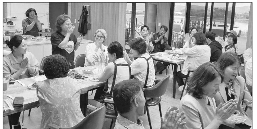
영암군 서호면 송산마을은 최근 주민과 외지인이 뜻을 모아 관계인구를 형성하고 공동체 활성화를 위한 ‘송산사랑 매킨리 결성식’이 개최됐다. 사진은 송산사랑 매킨리 결성식 모습.