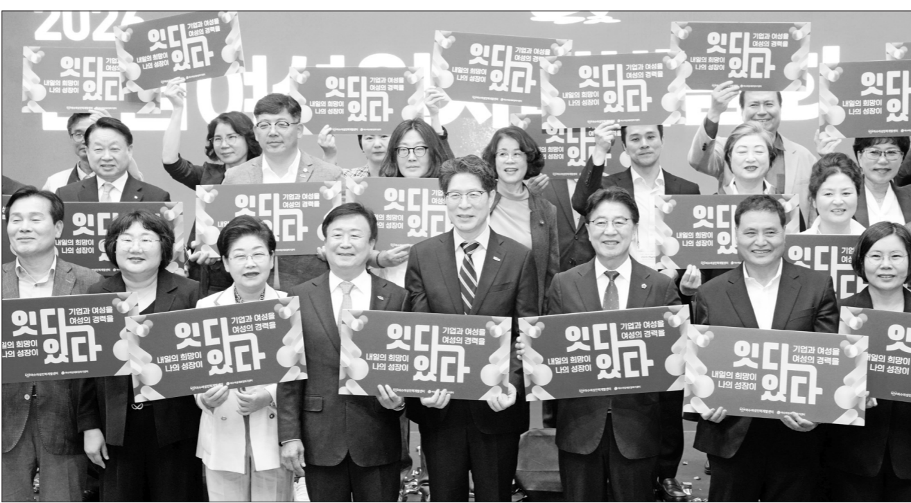
황기연 전남도 행정부지사가 20일 여수 흥국체육관에서 열린 2026년 전남 여성 일자리 박람회에서 참석자들과 기념촬영을 하고 있다.

여수서 올해 첫 개최...30개 기업 현장 면접 가족친화 특별관·SI 취업 특강 운영 등 호응