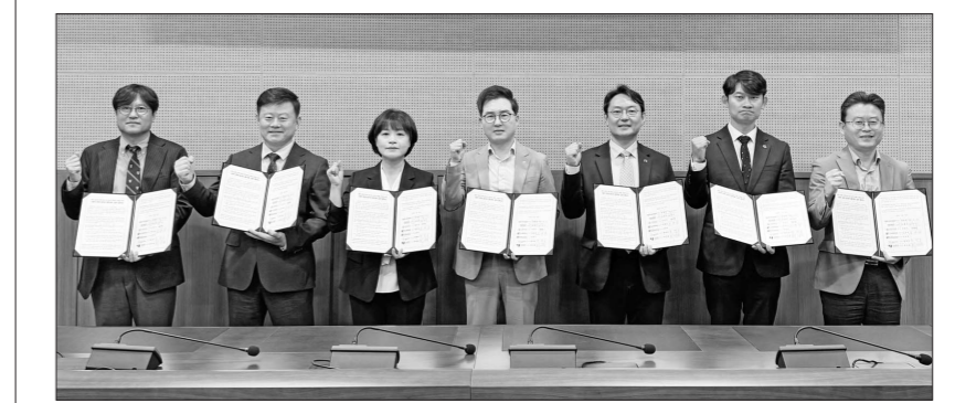
광주관광공사는 20일 김대중컨벤션센터에서 광주대, 서영대, 조선대, 조선이공대, 한국폴리텍대 광주캠퍼스, 호남대 등과 '광주 관광 일자리 협의체' 업무협약을 체결했다.