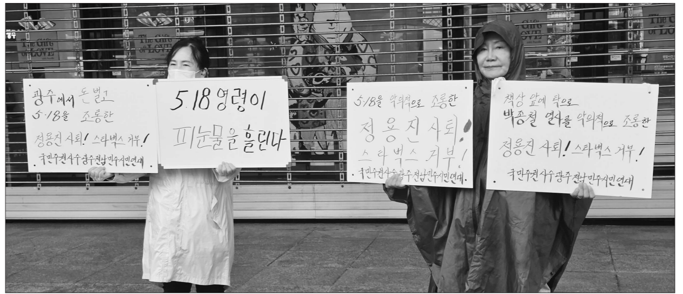
광주시민단체가 20일 광주 서구 광천사거리에서 '5·18 영령이 피눈물을 흘린다', '탱크데이로 5·18과 박종철 열사를 조롱했다' 등의 문구가 적힌 피켓을 들고 시위를 진행했다.