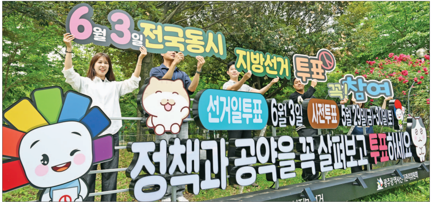
"꼭 투표 하세요" 제9회 전국동시지방선거를 이틀 앞둔 1일 오전 광주 서구 치평동 평화공원에서 광주시선관위 관계자들이 투표 참여 캠페인을 펼치고 있다. 투표는 선거일 기준 18세 이상의 국민으로 본인임을 확인할 수 있는 신분증을 지참하고 주민등록지 내 지정된 투표소에서 오전 6시~오후 6시까지 투표하면 된다. 한편 지난 주말 실시된 사전투표는 지방선거 기준으로는 최고치인 23.51%의 투표율로 마무리됐다.

하며 "민주당 원팀으로 현안을 풀겠다"고 강조했다. 같은 당 정청래 총괄상임선거대책위원장도 완도·장흥·순천·구례 등을 돌리며 민주당 후보 지원 유세에 나섰다. 국민의힘 이정현 후보는 광주 시내와 월드컵경기장 일대 등을 중심으로 차광순회 유세를 이어가며 "30% 지지를 얻으면 광주·전남 정치구조를 바꾸는 선거혁명이 될 것"이라고 호소했다. 이 후보는 AI·데이터산업, 신재생에너지, 광주공항 이전 부지 개발, 정부 특별지원금 20조원 순증 지원 등을 내세우며 일당 독점 구도에 대한 견제론을 전면에 세웠다. 진보당 이종욱 후보는 곡성과 광주 도심을 오가며 표심을 공략했고, 최근 지하철 공사 현장 일산화탄소 중독 사고와 관련해 철저한 조사와 안전관리 대책을 촉구했다. 정의당 강은미 후보는 광주 건어물유동 종합상사, 북구청 일대, 전남대 후문, 무가사 앞 삼거리 등을 돌며 상인과 청년, 시민들을 만났다. 전남광주교육자치조례제정 운동연대와 정책협약도 체결하며 교육자치와 민생 중심 선거를 강조했다. 무소속 김광만 후보도 담양과 광주 급남