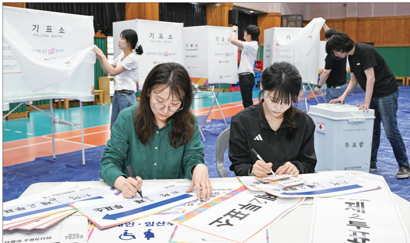
초등학교에 마련된 투표소 6·3 지방선거 본투표를 하루 앞둔 2일 광주 서구 치평초등학교에 투표소가 설치되고 있다. 투표는 선거일 기준 18세 이상의 국민으로 본인임을 확인할 수 있는 신분증을 지참하고 지정된 투표소에서 오전 6시~오후 6시까지 하면 된다.

박모(50·광주 서구 화정동) 씨는 "선거철마다 반복되는 무분별한 문자와 전화 때문에 불쾌감을 넘어 정치 자체에 대한 피로감이 생긴다"며 "유권자에게 다가가기 위한 선거운동이 오히려 역효과를 내는 것 같다"고 토로했다. 중앙선거관리위원회 홈페이지에도 관