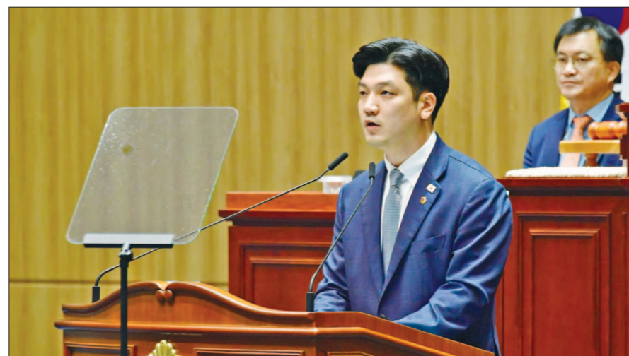
광주시의원 활동 모습.