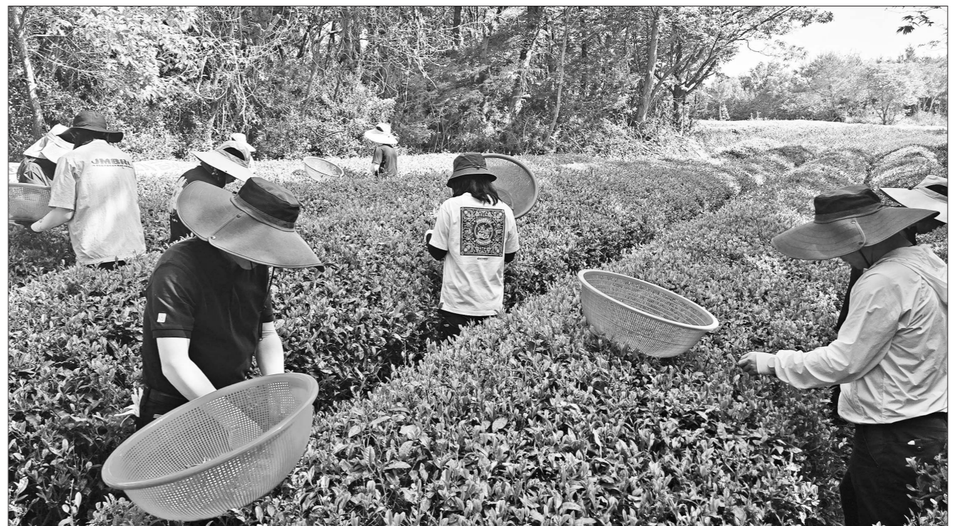
보성군 공무원들이 농민기 인력난 해소를 위해 농촌일손돕기에 나섰다. 사진은 차밭에서 과일 따기를 하는 모습.