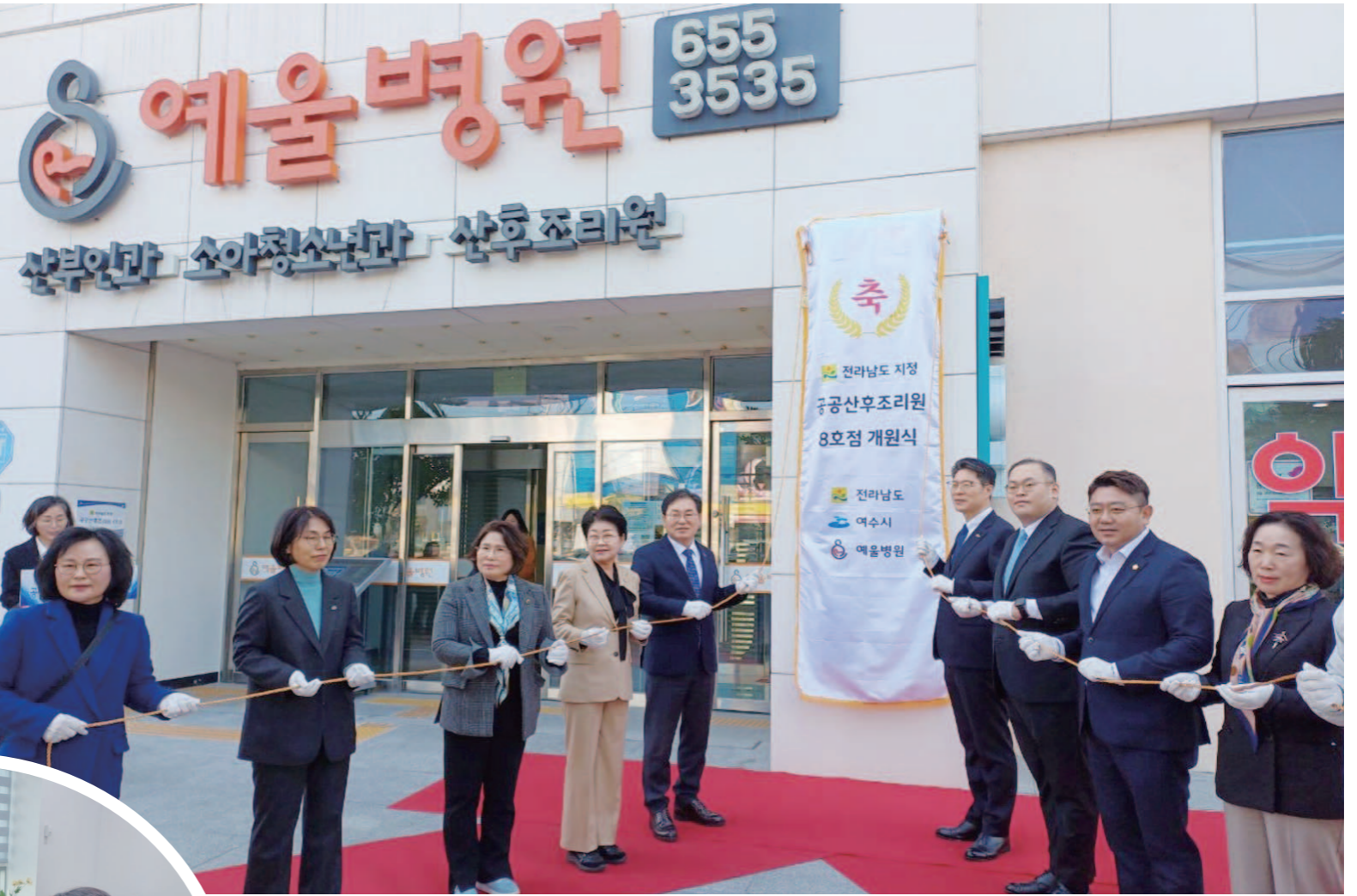
전남 공공산후조리원 8호점 개원식

임신 전, 초기에는 아이를 원하는 부부들이 비용 문제로 포기하지 않도록 필수 제한없는 전남형 난임 시술비 지원을 과감하게 도입했다. 가임기 부부 가임력 검사 확대와 난임·우울증 상담센터 운영을 통해 신체적·심리적 케어를 원스톱으로 제공하는 등 가임력 보존과 촘촘한 난임 지원 정책을 추진하