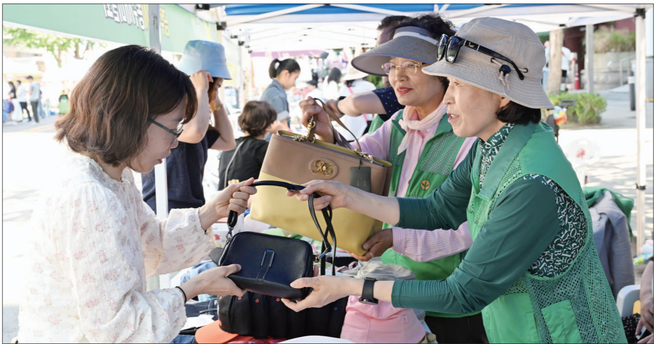
아나바다 장터 찾은 시민들 휴일을 맞아 6일 오후 광주 동구 금남로 차없는 거리를 찾은 시민들이 광주동구새마을 회원들이 마련한 자원순환 실천을 위한 아나바다 장터에서 물건을 고르고 있다.