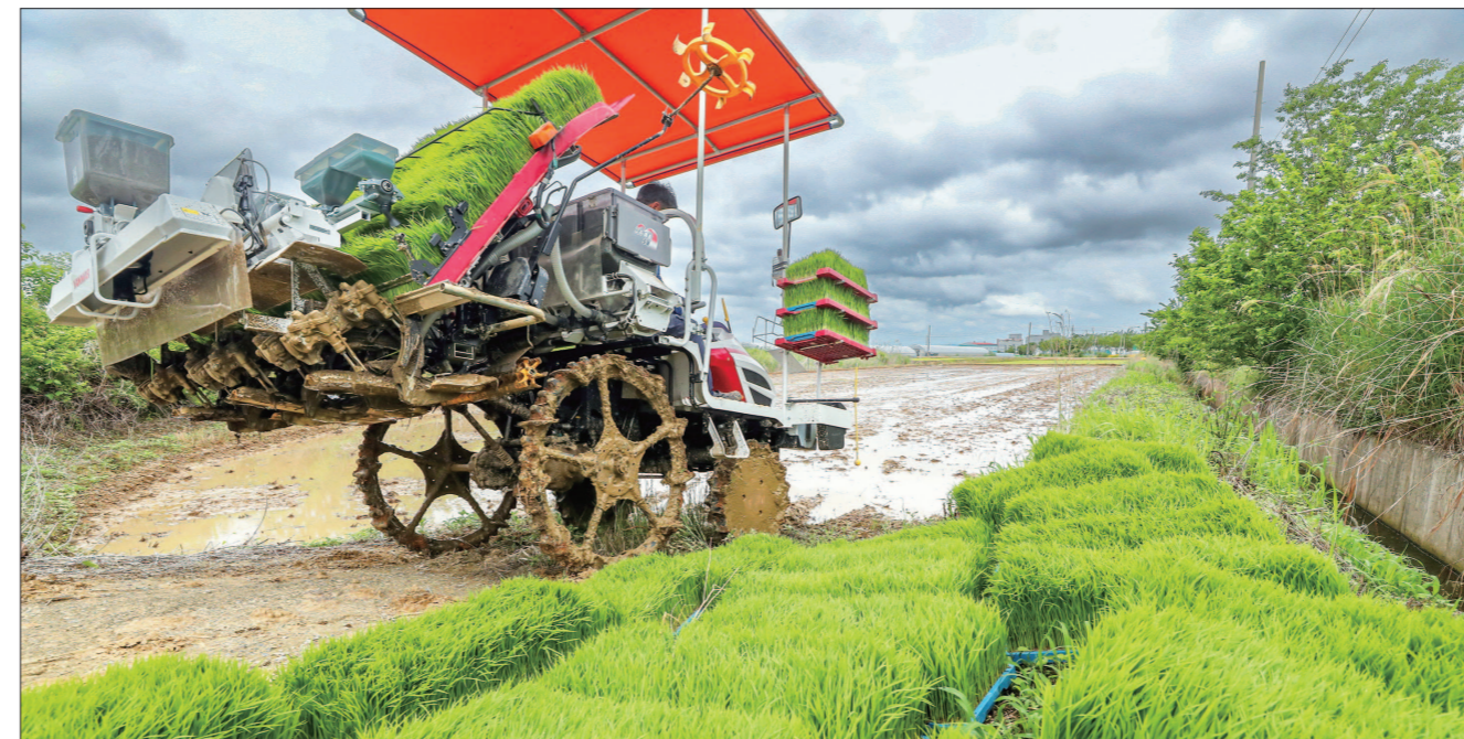
모내기하는 농민 8일 전남 나주 신평면 들녘에서 한 농민이 이앙기로 모를 심고 있다. 모내는 시기는 지역·품종·기상환경·이앙기의 활용·노동력의 확보 등에 따라 달라지며 중부지방은 6월 하순, 남부지방은 7월 상순 전에 실시한다.