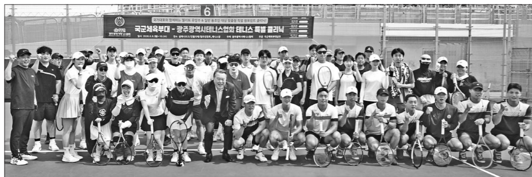
광주시체육회가 국군체육부대 테니스팀과 함께 지역 테니스 활성화를 위한 특별 재능기부 행사를 마련했다.

강습은 일정별로 대상자를 나눠 진행된다. 첫날인 8일에는 살레시오중·고등학교 소속 전문선수 15명을 대상으로 훈련이 이뤄졌으며, 9일에는 동