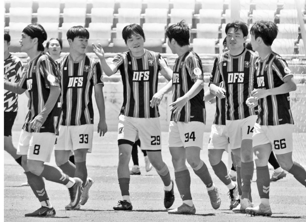
호남대학교 축구학과 학생들이 구성된 호남DFS가 ‘제1회 JUFA CUP’ 정상에 오르며 초대 챔피언에 등극했다.