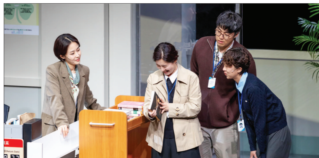
국립아시아문화전당재단은 국립아시아문화전당 창·제작 연극 '사사로운 사서'를 오는 6월 20일부터 28일까지 국립극단 명동예술극장에서 선보인다.

작품은 도서관을 배경으로 한 드라마 연극이다. 침수된 장서의 복구와 인물의 내면적 회복 과정을 교차해 보여준다. 특히 도서관을 무대 위에 그대로 구현해 관객의 몰입도를 높였다. 서로 다른