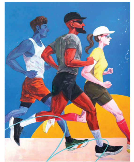
성낙진 작 '나는 나에게 도착하는가' ▶