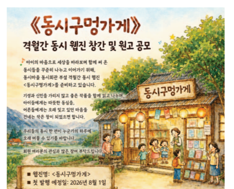
동시구명가게 창간호 원고 공모

'동시구명가게'라는 이름에는 누구나 마음 편히 들러 쉬어갈 수 있는 작은 공간처럼, 한 편의 동시가 독자의 하루에 오래 머무는 여