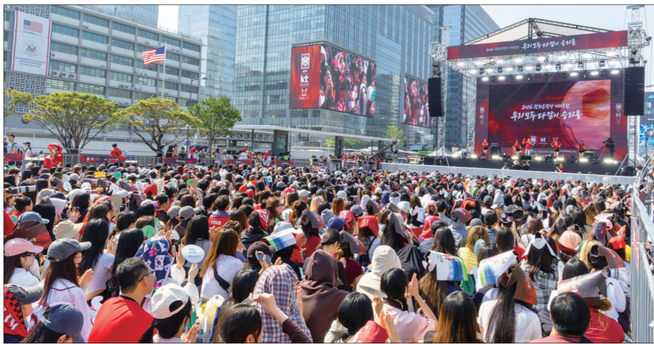
지난 12일 서울 광화문광장에 '2026 북중미월드컵' 한국-체코전을 응원하기 위해 시민들이 모였다.