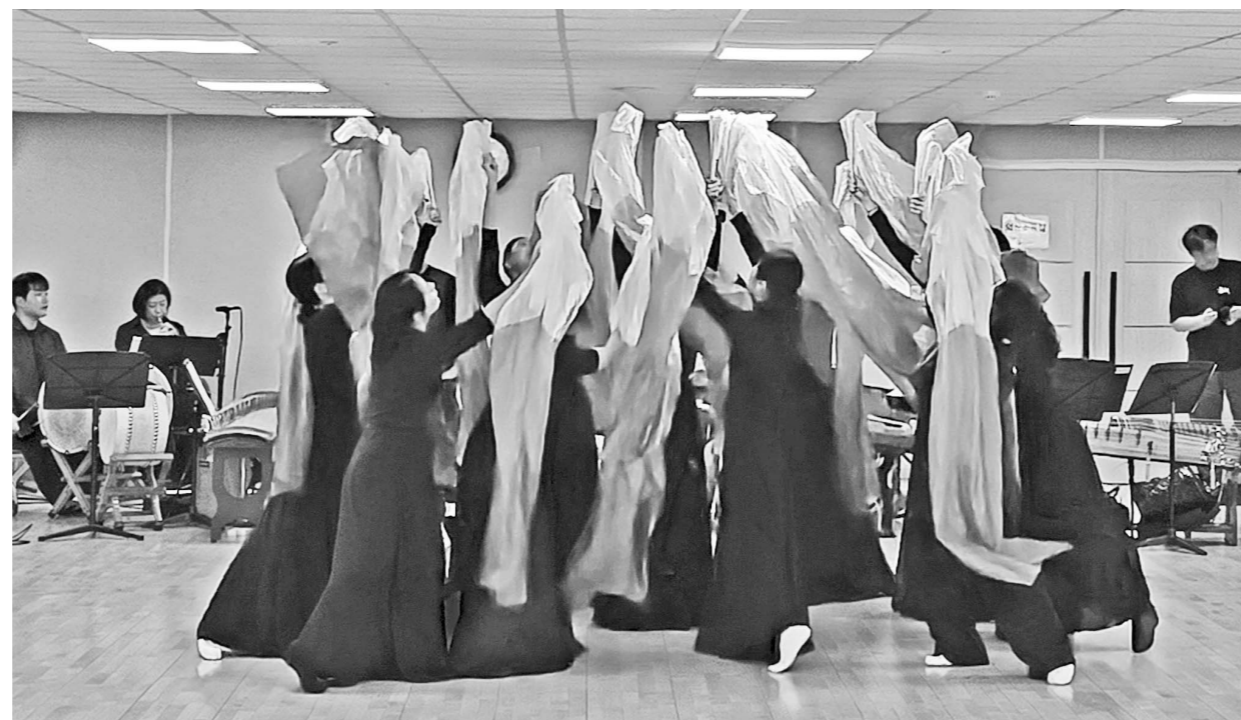
광주시립창극단은 26일 오후 7시30분 광주예술의전당 소극장에서 국악의 날 기념 특별기획공연 '희경루방회도'를 선보인다. 광주시립창극단원들이 특별기획공연 '희경루방회도'에서 희경루가 불에 타는 모습을 보여주며 있다.