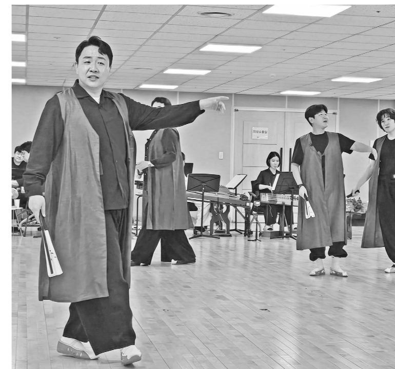
시립창극단 단원들이 최근 광주예술의전당 대연습실에서 '희경루방회도' 중 한량무를 추는 선비들의 호연지기를 공연하는 모습.