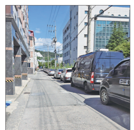
광주 동구 서석동 423-11~433-2 구간이 7월부터 일방통행으로 변경된다.

그러나 도로 한쪽에 차량이 주차될 경우 차량 교행이 사실상 불가능해 실질적으로는 일방통행로처럼 운영되고 있다. 주변에는 조선대와 조선대 치과병원, 주택가, 음식점, 편의점이 밀집해 있으며 조대여중·고와 살레시오여고도 위치해 있다. 이 때문에 등·하교 시간에는 학부모 차량까지 몰리면서 극심한 정체와 발생 민원의 설명이다. 특히 서석동 421-5번지 부지 주차장이 지난해 10월 유료로 전환된 이후 인