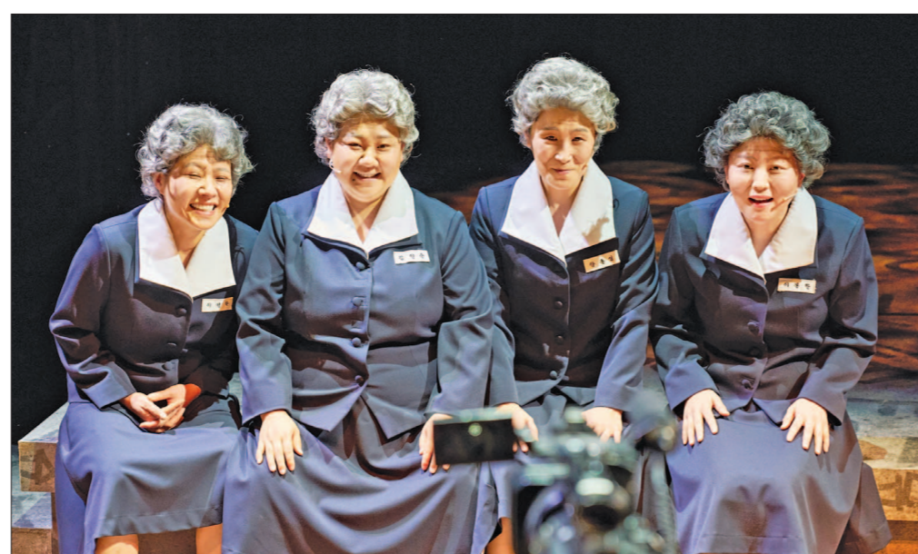
국립아시아문화전당재단은 ACC 초이스 세 번째 작품으로 창작뮤지컬 '오지게 재밌는 가시나들'을 오는 8월 14일부터 16일까지 ACC 예술극장 극장2에서 선보인다. '오지게 재밌는 가시나들' 공연 모습.

이 작품은 한국콘텐츠진흥원 창작뮤지컬 공모전 '글로벌 뮤지컬 라이브 시즌7'과 한국문화예술위원회 '2024 공연예술창작산실 올해의 신작'에 선정되며 작품성을 인정받았다. 지난해